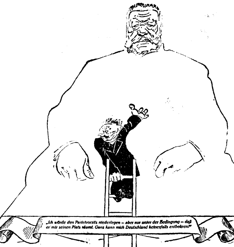
HUGENBERG.—En ese sitio debería estar yo, que soy necesario para el Estado. (Desde que firmó el plan Young, nacionalistas y ultranacionalistas han roto con el mariscal.)