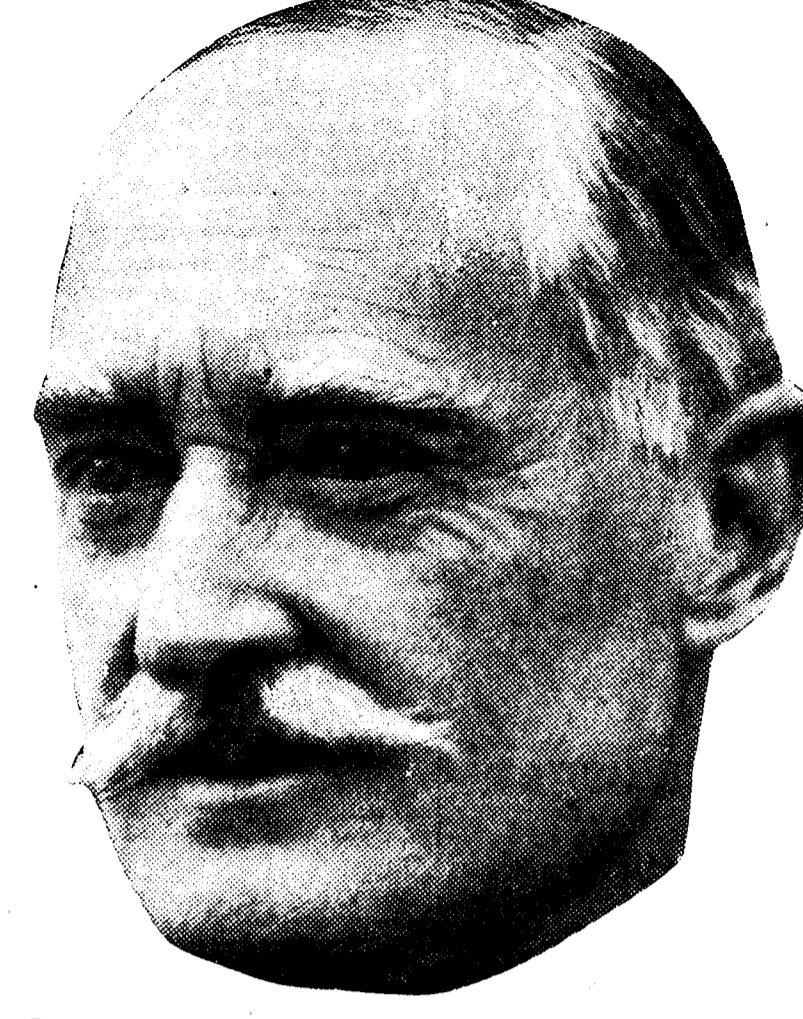
Sir Esmé Howard, embajador de Inglaterra en Washington, que ha dejado la Embajada y se retira de la vida diplomática

Sir Howard es uno de los más prestigiosos diplomáticos británicos. Nació en 1863 y tiene en la actualidad sesenta y siete años. Ingresó muy joven en la diplomacia y estuvo en la guerra sudafriana. Su primer cargo fué el de cónsul en la isla de Creta, desde donde fué nombrado sucesivamente ministro en Berna y en Estocolmo. En 1919 el Gobierno inglés le encargó una misión especial en Varsovia. Por sus méritos se le nombró poco después consejero privado de la Corona. Pasó luego a España y estuvo de embajador en Madrid desde 1919 a 1924, en que fué trasladado a la Embajada de Washington, el primer cargo diplomático inglés. Allí ha permanecido hasta ahora, en que voluntariamente se retira de su puesto.