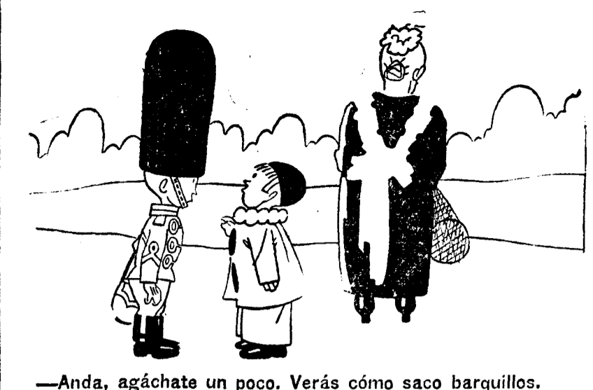
—Anda, agáchate un poco. Verás cómo saco barquillos.