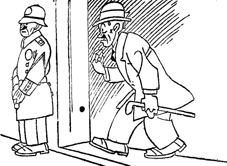
-Pues, señor, ¡qué mal "saborit" de boca dejari!