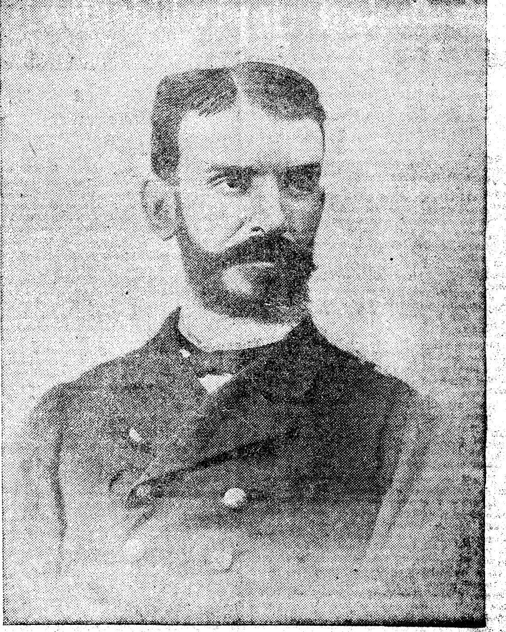
D. ISAAC PERAL

A Cartagena le cabe la honra de contar entre sus proclamos hijos á D. Isaac Peral y Caballero, que muy niño, á los catorce años, ostentó el honoroso botón de ancla, ingresando en el Colegio Naval Militar el 1 de Julio de 1865. Su brillante historia militar en el Colegio, y desde el 21 de Marzo de 1872 en que fue promovido á alférez, hasta el 5 de Enero de 1891, que voluntariamente solicitó y obtuvo su licencia absoluta, está esmaltada de honoríficos hechos de armas, de comisiones técnicas y de mandos que le acreditan de experimentado y bizarro marino, de hombre estudioso y de sabio profesor, explicando desde el año 1883 hasta el 1885 la clase de Física matemática en la Academia de aplicación de San Fernando.