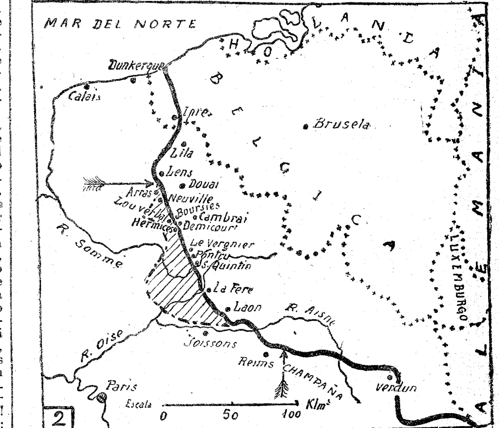
Posición de los franco-ingleses en 15 Marzo 1917. Zona reconquistada por los franco-ingleses.

Desde Soissons hasta la Champaña occidental (parte oficial alemana) hay intenso bombardeo, así como entre Lens y Neuville Vitasse (croquis 1 y 2). Y algo más. Sí, señores, algo más. Los ingleses, en un frente de unos 19 kilómetros, desde el Sur de Givrenchy, en Gohelle, hasta Henin-sur-Cojeul (croquis 1), han derrotado á los alemanes, apoderándose de la granja de La Folie. Llegando á las alturas de Vimy y tomando Thelus, Athies, Feuchy y Chapelle, después de haber estado por Saint Laurent, Biagny, Tilloy-les-Mofflaines, Neuville Vitasse y Henin-sur-Cojeul, Rasmussen. Un avance de unos tres kilómetros por término medio y un botín de 5.816 soldados prisioneros, de los que 119 son oficiales, amén de otros que no han sido contados aún, así como tampoco los cañones, morteros y ametralladoras que han caído... Y algo más. Sí, señores, algo más. Los ingleses (croquis 2), que estaban por Louverval, han llegado á Bousser, Demicourt y Hermies, camino de Cambrai, y los que estaban al Noroeste de San Quintín han avanzado al Sur de Le Vergnier habiéndose apoderado de Pontra. Entre el Somme y el Aisne (frente francés), calma relativa y San Quintín esperando á Rostevelli. No creo haber dejado ni un átomo de gloria inglesa en el tintero.