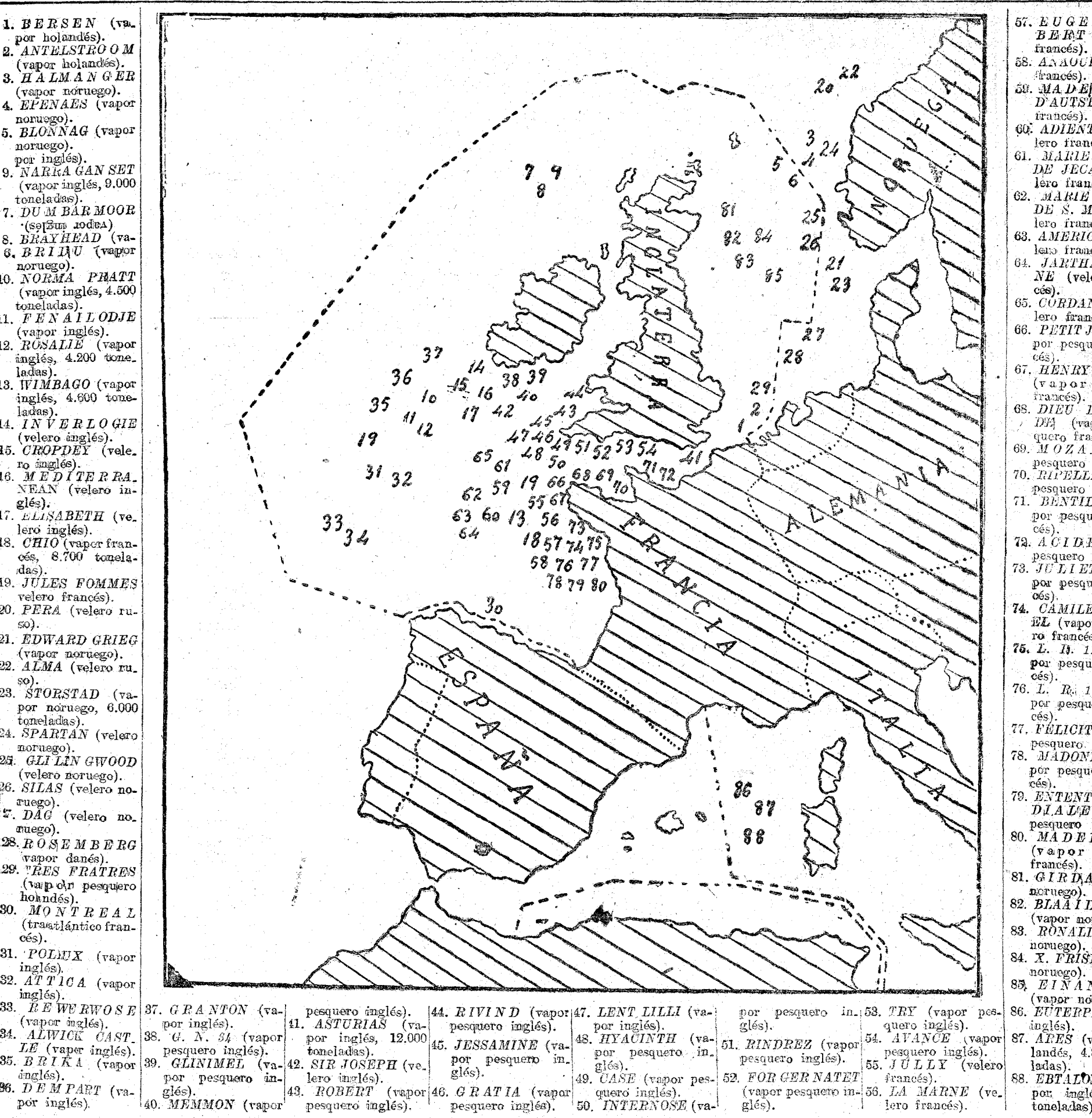
33 barcos hundidos por los submarinos alemanes durante los últimos cinco días

37 ingleses, 29 franceses, 15 noruegos, 4 holandeses, 2 rusos y 1 danés. Durante el mes de Marzo han sido echados á pique, por los submarinos alemanes, 214 barcos: 90 ingleses, 44 franceses, 32 noruegos, 8 italianos, 7 holandeses, 6 portugueses, 6 griegos, 5 norteamericanos, 5 rusos, 4 españoles, 3 belgas, 2 daneses y 2 suecos.