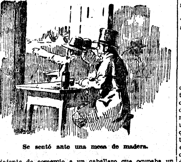
Se sentó ante una mesa de madera.

Entro en el mesón con honores de hostería, se sentó ante una mesa de madera, reluciente como un espejo, y se hizo servir un gran trozo de carne fiambré, con el aditamento del correspondiente pan, de una botella de vino añejo y de algunas frutas del tiempo.