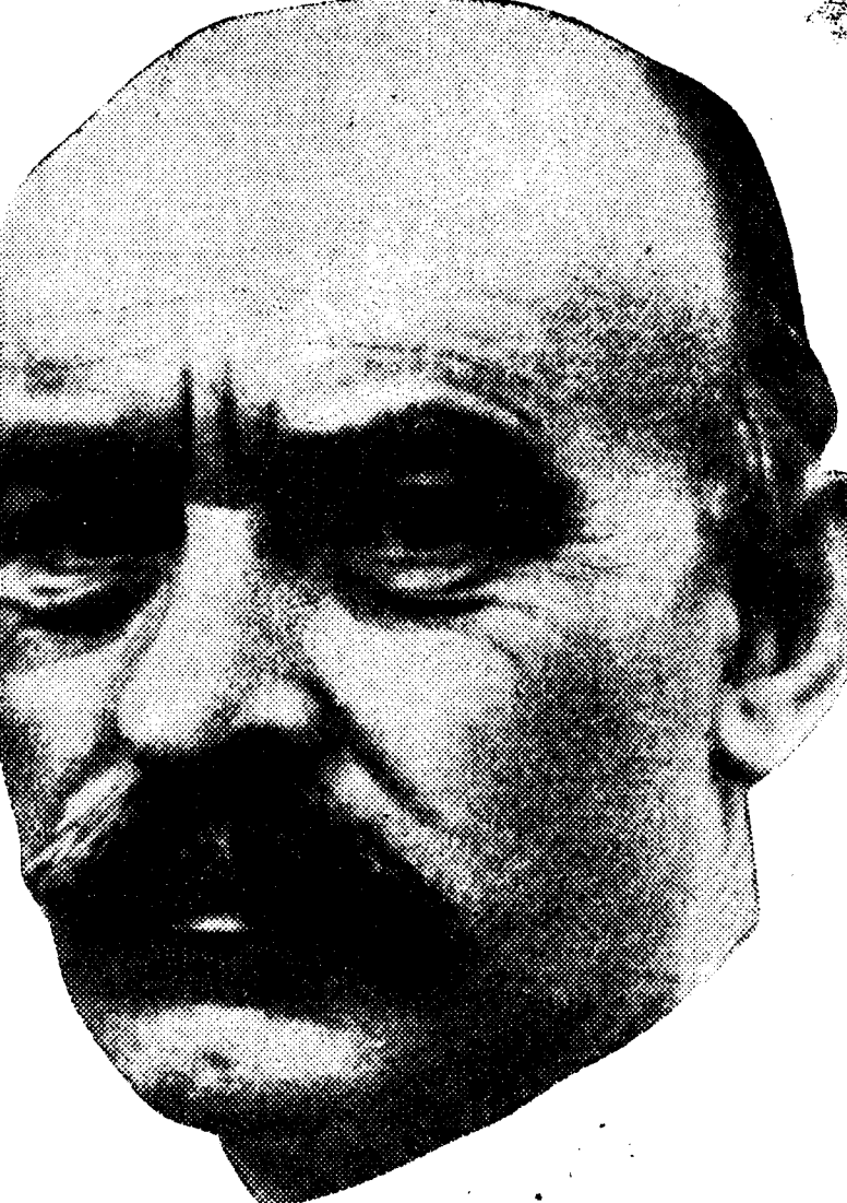
El ministro de Negocios Extranjeros de Yugoslavia, Voyislav Marinkowich, que preside la reunión actual del Consejo de la Sociedad de las Naciones

Marinkowich es uno de los políticos yugoeslavos de más destacada personalidad. En la plenitud de la vida—tiene poco más de cincuenta años—, es ya un hombre de Gobierno cos larguísima y fecunda experiencia. Un, pues, a la fortaleza física de quien puede aún pasar por joven, la práctica y la prudencia de un anciano. Lleva más de veinte años de vida pública, y a los treinta y ocho era ministro de la Guerra. En 1927 firmó por Yugoslavia un Tratado de amistad con la república francesa. Marinkowich se formó políticamente—como científico de la política—en la Sorbona.