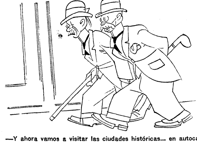
—Y ahora vamos a visitar las ciudades históricas... en autocar.