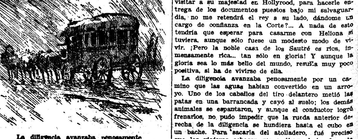
La diligencia avanzaba pesosamente

La diligencia avanzaba pesosamente del convento, puesto que no ha entrado en él cediendo a una vocación religiosa que no siente, y la llevará a mi casa, a casa de mis padres, que estoy seguro de que la recibirán con los brazos abiertos!