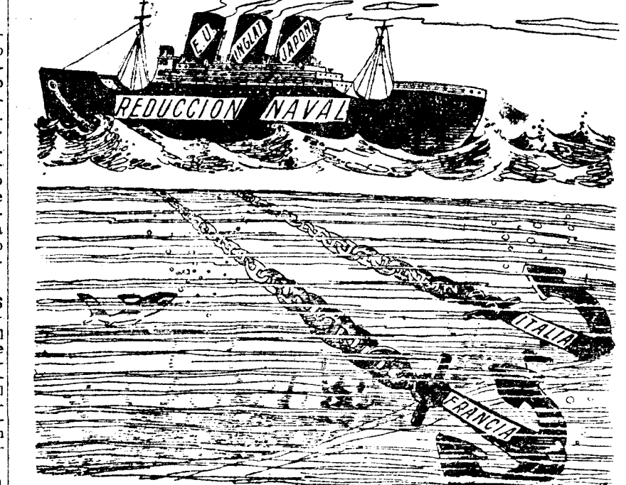
Será difícil que ese barco consiga ningún "record". ("Philadelphia Record")