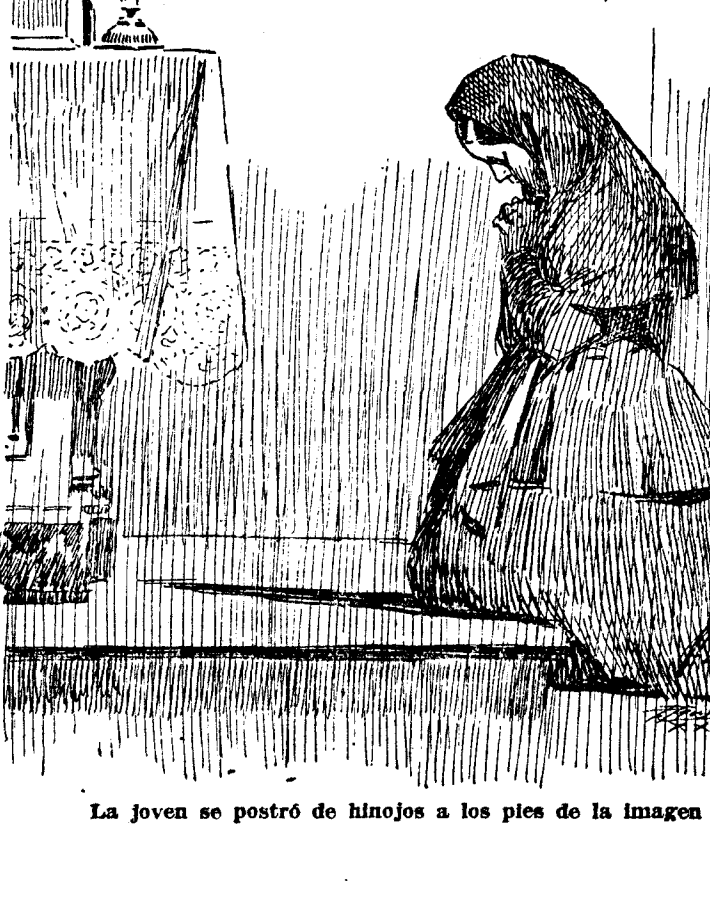
La joven se postó de hinojos a los pies de la imagen