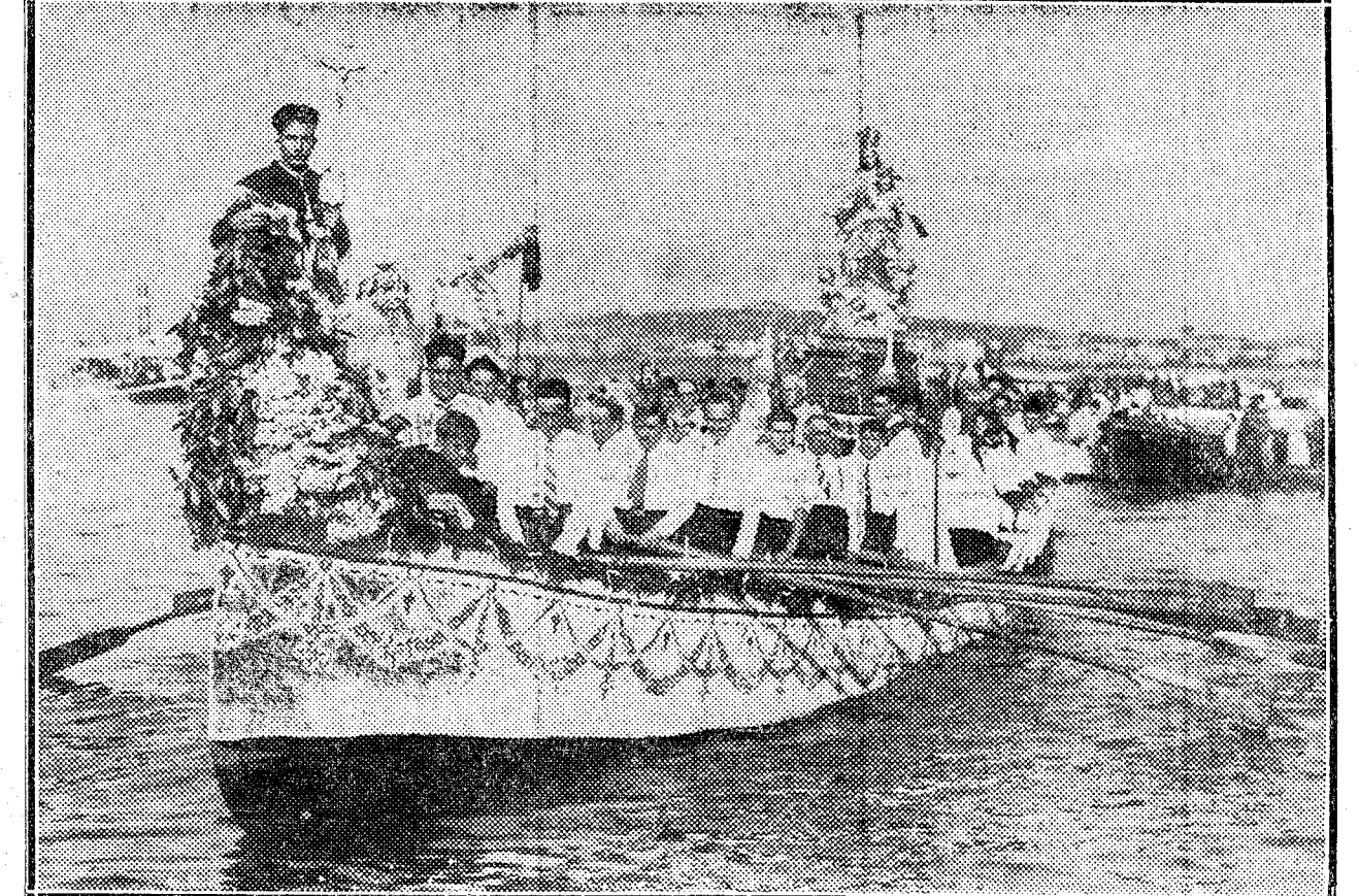
Regreso de la procesión marítima de la Virgen del Carmen en Bilbao