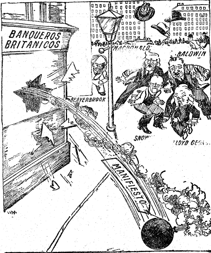
LOS BANQUEROS HAN ARROJADO UNA BOMBA. (Glasgow, "Bulletin".)

Quince banqueros ingleses han publicado un manifiesto en contra del intercambio británico.