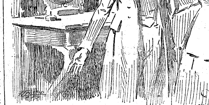
Tienes razón; con esta indumentaria