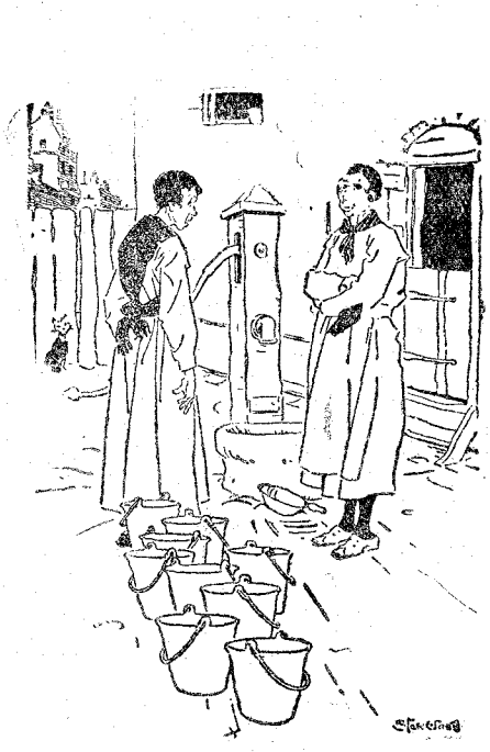
—¿Y para qué necesita usted llevar precisamente ocho cubos? —Porque tengo que ahogar a un gato.