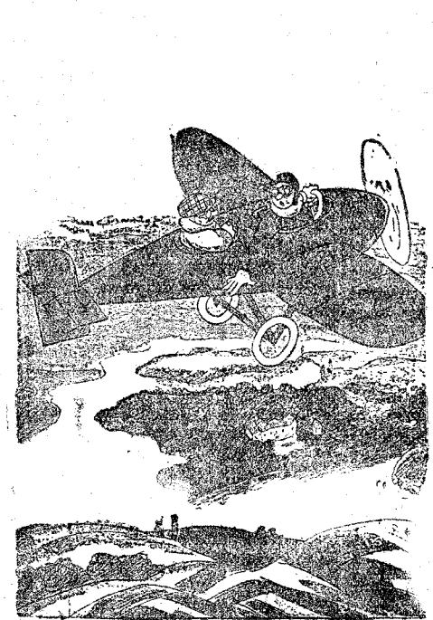
—¿Hace mucho tiempo que se dedica usted a la aviación? —¡Oh, ya lo creo! Desde que era así.