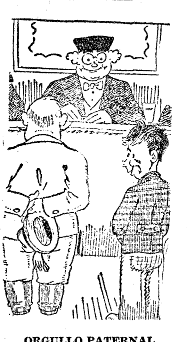
ORGULLO PATERNAL EL JUEZ (al padre del ladronzuelo).—¿Ha habido algún ladrón en la familia? EL PADRE.—Ninguno, señor juez. No puedo explicarme cómo este muchacho ha salido tan listo.