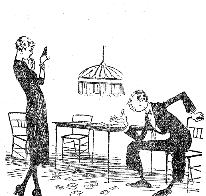
—Me ha extrañado que perdieras de ese modo los estribos jugando a las cartas. —Hija mía; no me quedaba otra cosa que perder.