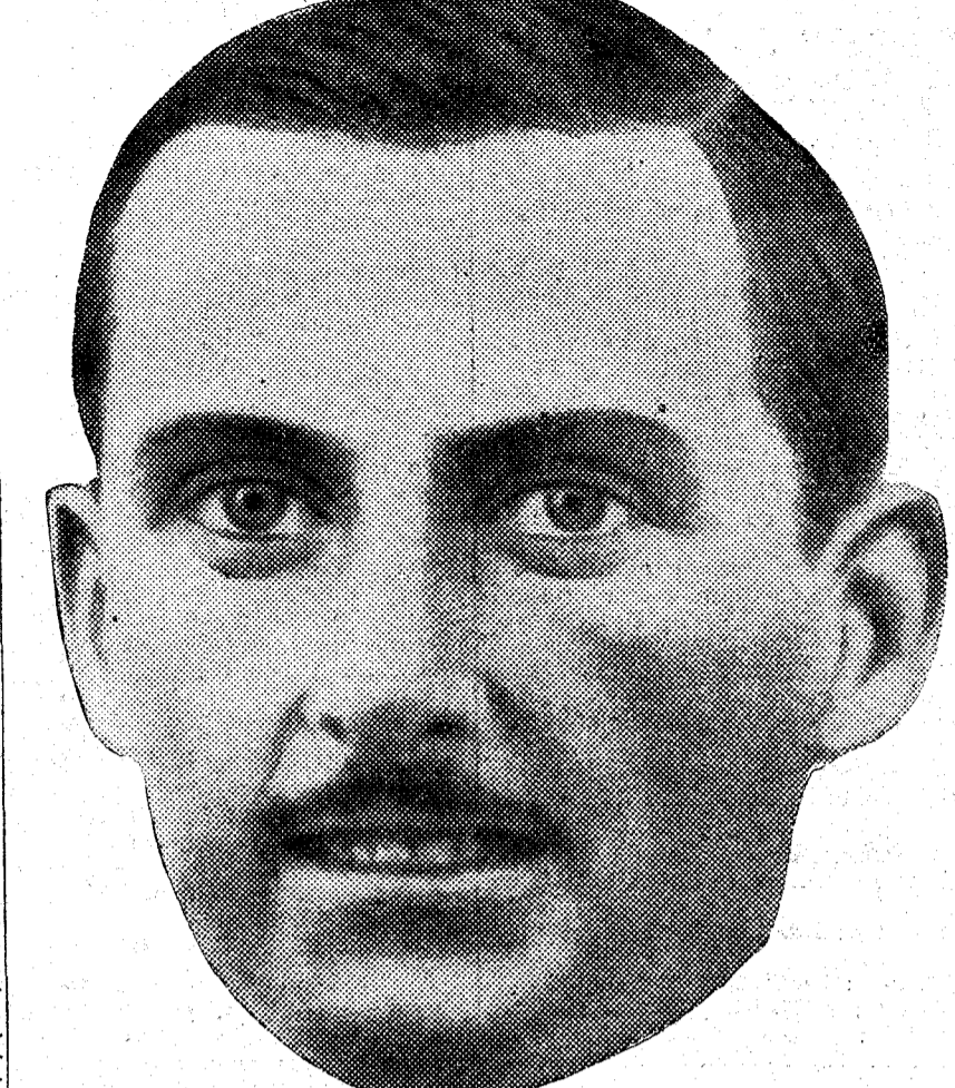
Su alteza real don Antonio de Habsburgo y Borbón, archiduque de Austria, que ha realizado notables pruebas aéreas en Barcelona