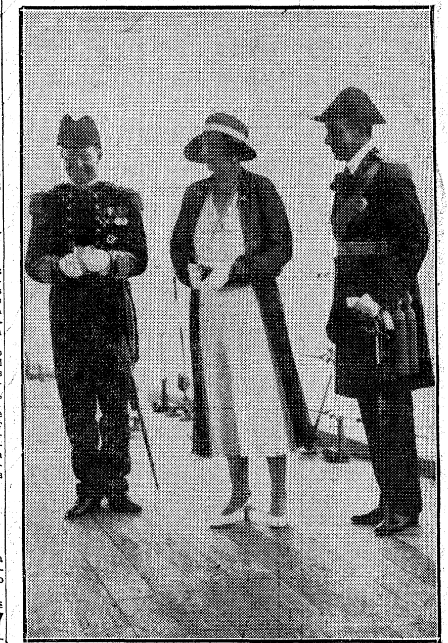
Arriba, sus majestades con el almirante del crucero inglés, y abajo, el Rey en el momento de su llegada al buque