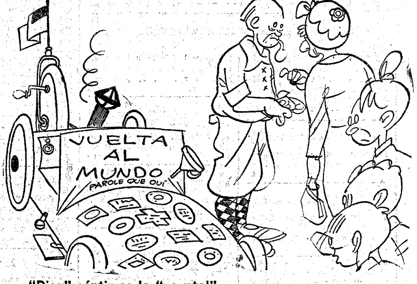
—"Dieg" séntimos la "pogstal". —Tenga; pero dé otra vueltécita, que yo acabo de llegar ahora.