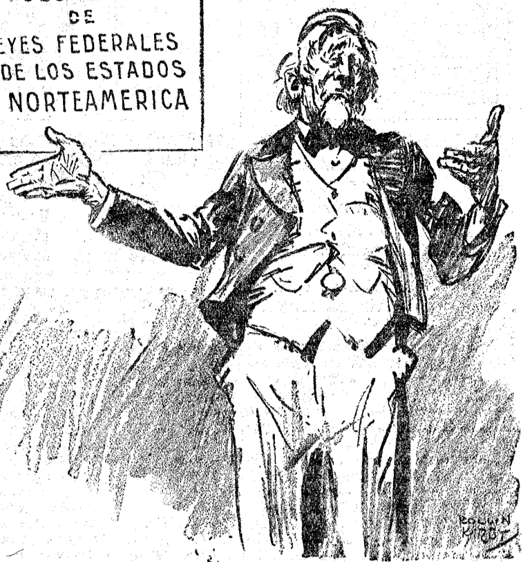
EL AÑO QUE VIENE HABRA MAS ("New York World.")

HAY 3.500 VOLUMENES DE LEYES FEDERALES Y DE LOS ESTADOS EN NORTEAMERICA