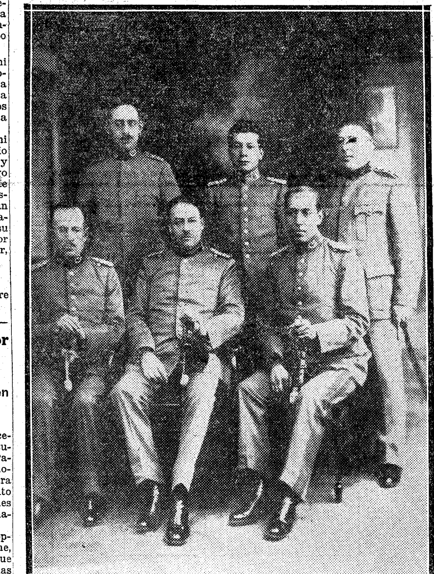
EL GOBIERNO PROVISIONAL DE BOLIVIA.—Sentados de izquierda a derecha: el general Madariaga Pando, ministro de Estado y Hacienda; el general Galindo, presidente, y el coronel Ossorio, ministro de Instrucción pública. De pie, de izquierda a derecha: teniente coronel Langa, ministro de la Guerra; teniente coronel Bilbao, ministro de Comunicaciones, y coronel Quiroga, ministro de la Gobernación e Higiene.