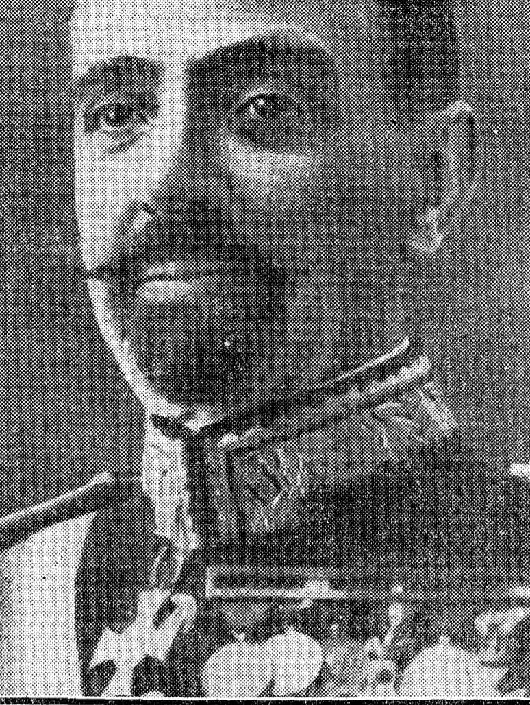
El general Despujols, gobernador de Barcelona, que ha encauzado con acierto los incidentes de la huelga