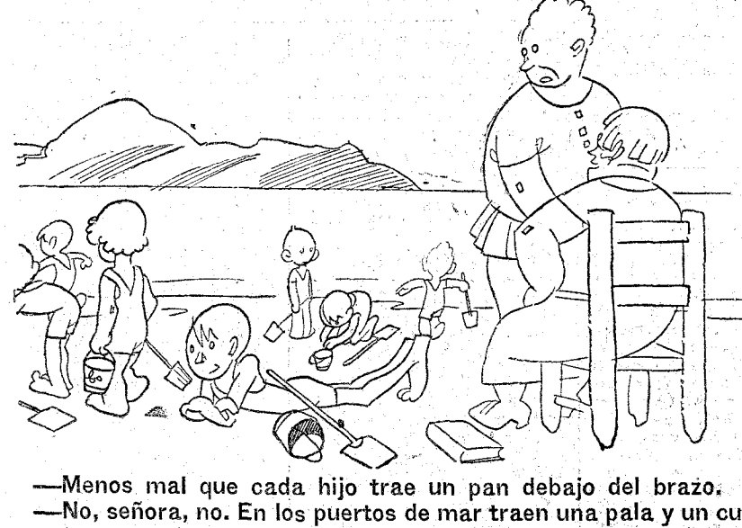
—Menos mal que cada hijo trae un pan debajo del brazo. —No, señora, no. En los puertos de mar traen una pala y un cubo.