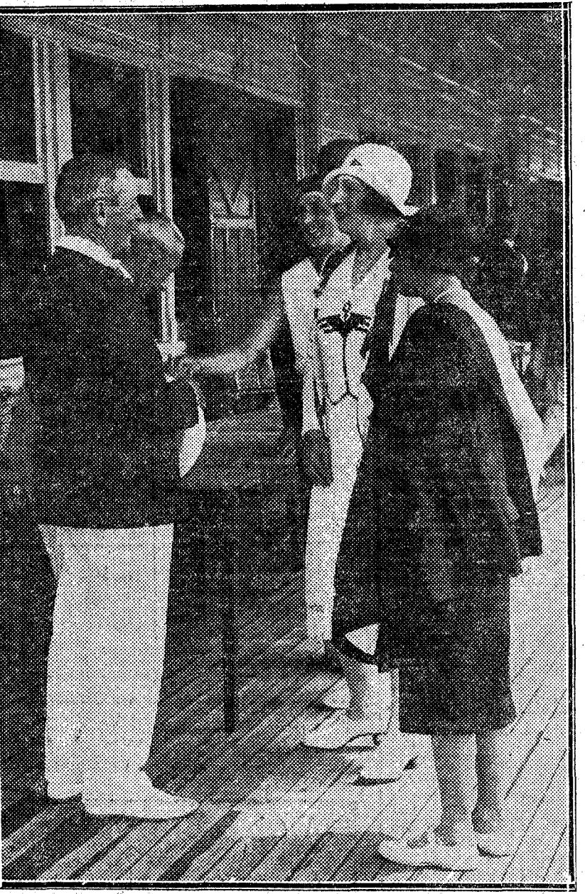
Su majestad la Reina y la infanta Cristina felicitando a sir Pomeroy Burton, ganador de la copa del Rey en las regatas a la vela