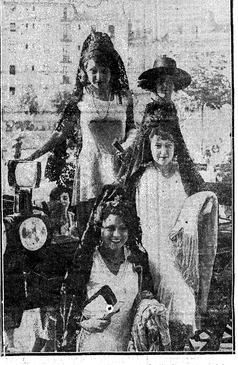
Las señoritas que presidieron el festival tauquino del club Félix Rodríguez

Doctor X (Barcelona).—Con mucho gusto recibimos y contestamos su apreciada. He aquí la respuesta. El conocimiento se verifica procediendo de lo sensible a lo inteligible, pues los sentidos son los que excitan la actividad intelectual, y en este aspecto es cierto lo que usted dice, que "nihil est in intellectu quod prius fuerit in sensu"; mas esto es falso en absoluto, creyendo que los sentidos son causas totas y únicas de todas las ideas. Y es falso, porque existen muchas que las forma la sola inteligencia, y todas las universales, se forman y completan por la abstracción intelectual. Complacido, doctor. Un cualquiera (Almería).—¡Hombre, por lo visto esa chica "es una cosa muy seria": virtuosa, educada, guapa, y con fortuna! ¡Un mirlo blanco! Lo de la "mala cabeza" de usted... en tiempos de con tal de que luego se haya usted convertido en un hombre "con cabeza" no lo estime obstáculo invencible. Que "ella" sepa y vea que es usted otro, y que realmente la quiere. Más tarde no vacile en pretenderla, mostrándose no levemente sincero. Irls (Badajoz).—¿No ha adivinado usted lo que él busca con esa pretexto es reanudar las relaciones? Por Dios, señorita, si eso resulta de una transparencia absoluta. F. 538 F. (Caranica).—Respuestas: Primera. Del galán. Segunda. Enamora-