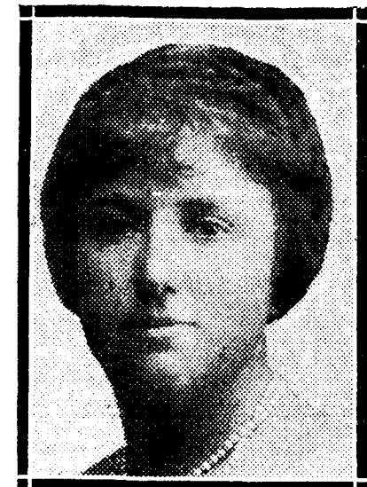
gusta hija, la infanta doña Isabel Alfonso, condesa de Zamoyski, ha dado a luz un robusto varón. El infante don Carlos se propone salir la semana próxima para la capital de Hungría con objeto de apadrinar a su primer nieto.

BARCELONA, 29.—El infante don Carlos ha recibido un telegrama de Budapest dándole cuenta de que su au-