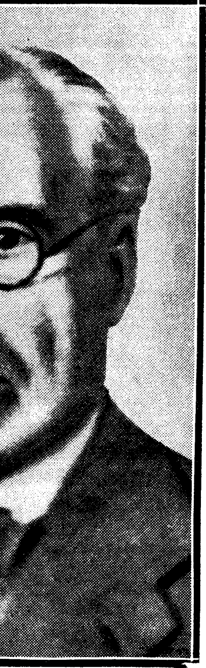
El maestro Lamotte de Grignon, a quien han sido impuestas las insignias de la cruz del Mérito civil

El maestro Lamotte de Grignon es una de las más relevantes figuras de la música en Cataluña. Trabajador infatigable, creó la Orquesta Sinfónica de Barcelona y, después, la Banda Municipal, cuya influencia artística es enorme, ya que ha logrado elevar el nivel de la masa popular de oyentes, como lo demuestran los conciertos matinales en la Plaza del Rey de la Ciudad Condal, imponentes por el número de personas que asisten y que veneran al gran maestro. Lamotte es también compositor de altura, destacándose entre sus obras el poema "Andalucía", en el que el ilustre Pablo Casals ha interpretado varias veces el "solo" de violoncello.