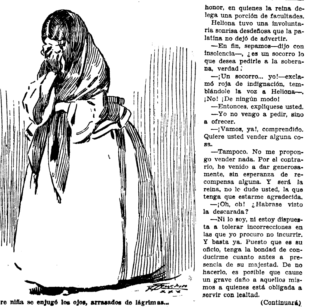
La pobre niña se enjugó los ojos, arrasados de lágrimas...

—Pero cuando se trata de cosas graves que no admiten demoras... —Ni aún en ese caso. Precisamente para eso estamos las damas de