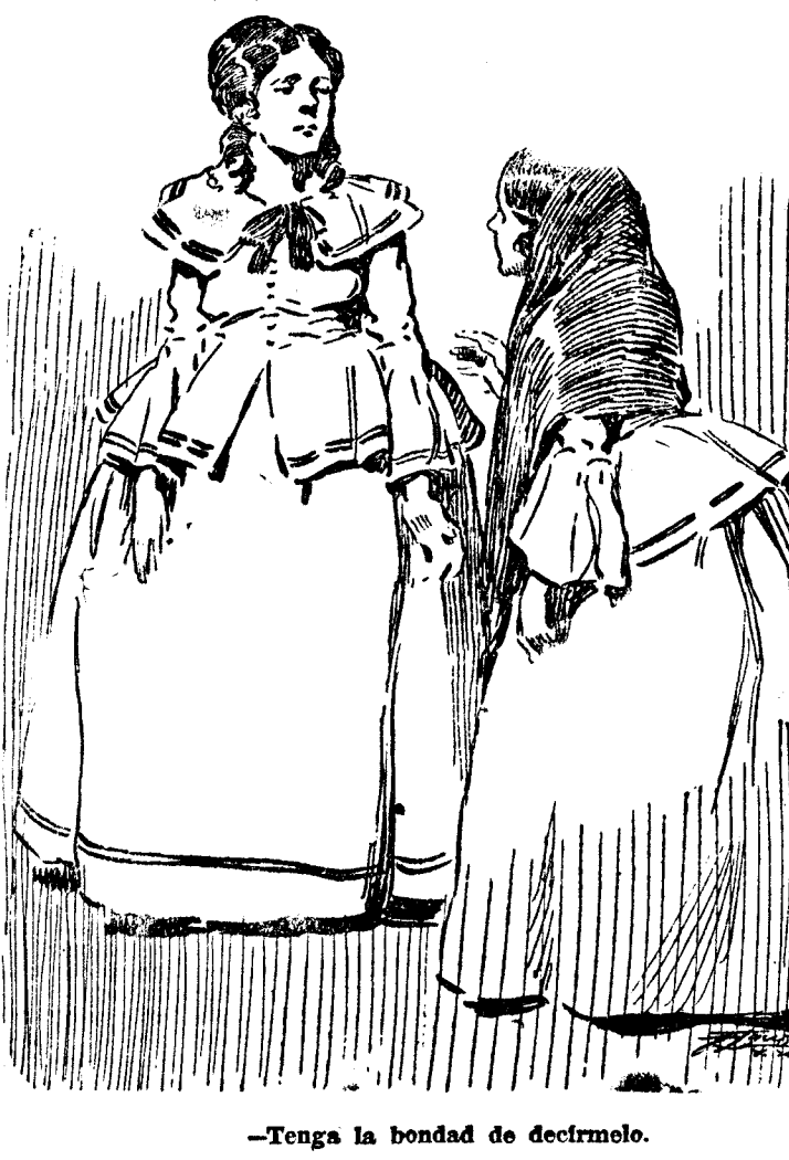
—Tenga la bondad de decirme lo que era, precisamente, la hora del desayuno. Llegó al parque e hizo que condujeran a su presencia a Heliona.

La dama de honor obedeció de malísima gana, por-