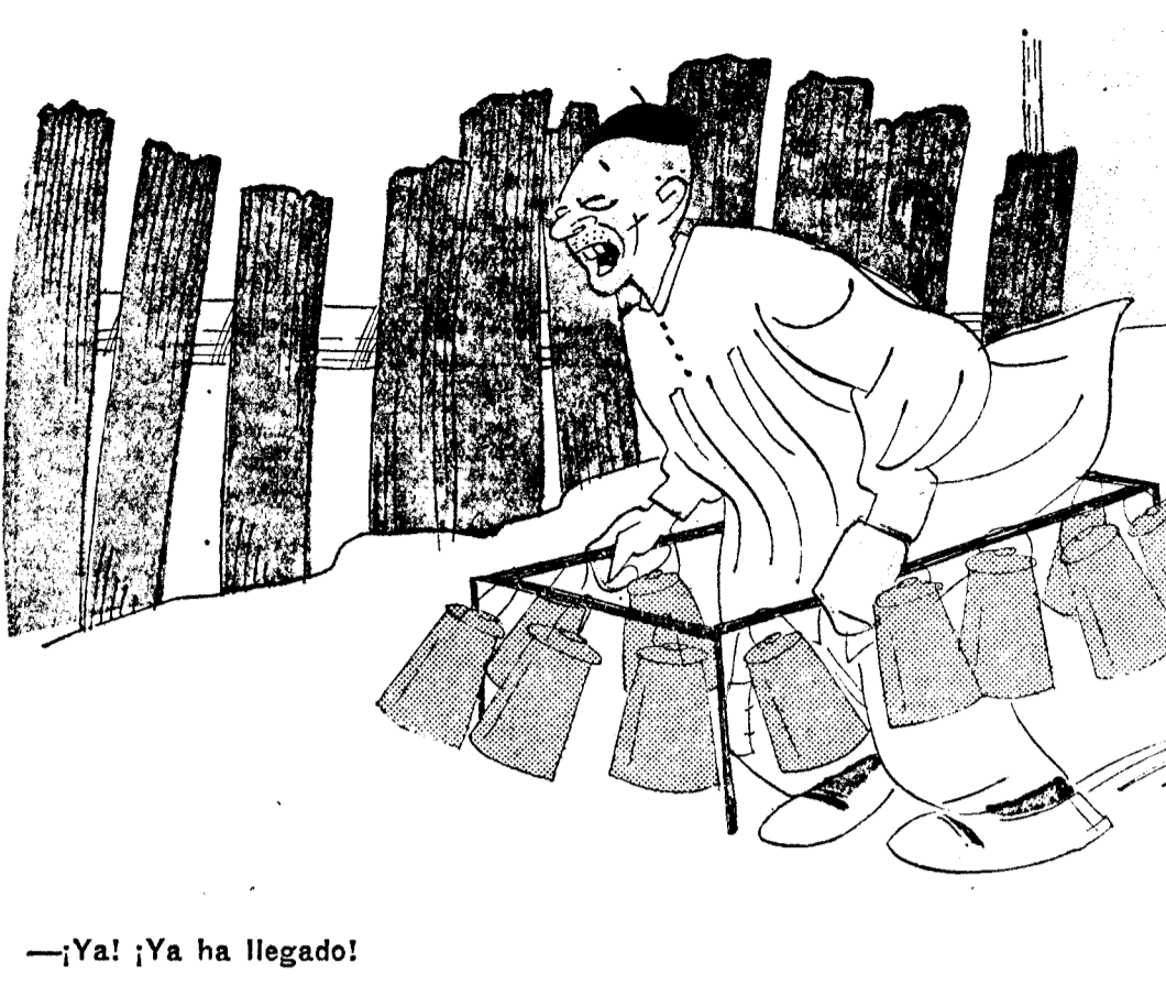
¡Ya! ¡Ya ha llegado!