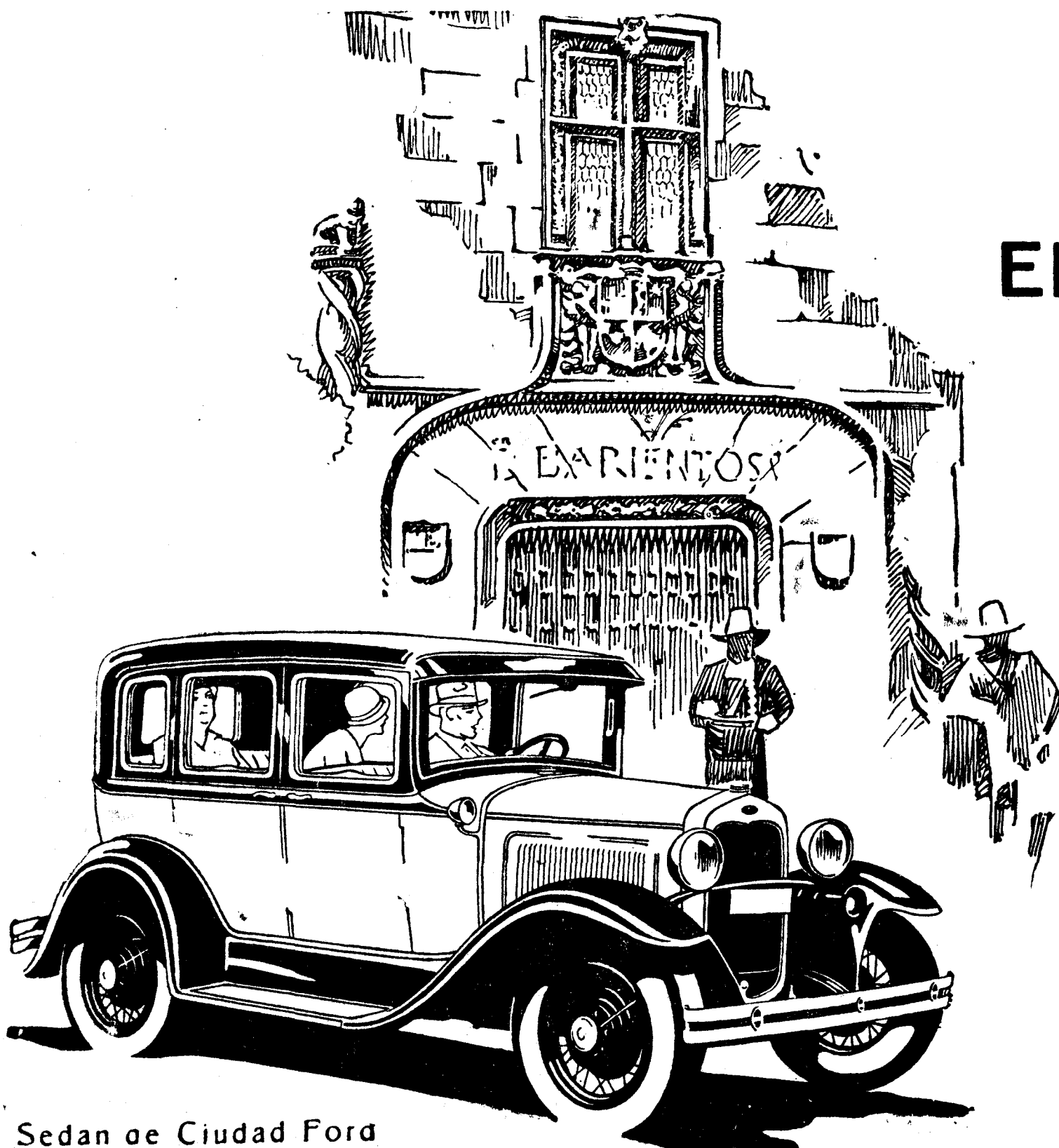
Sedan de Ciudad Ford

En ciudad y carretera, cuenta los coches FORD.