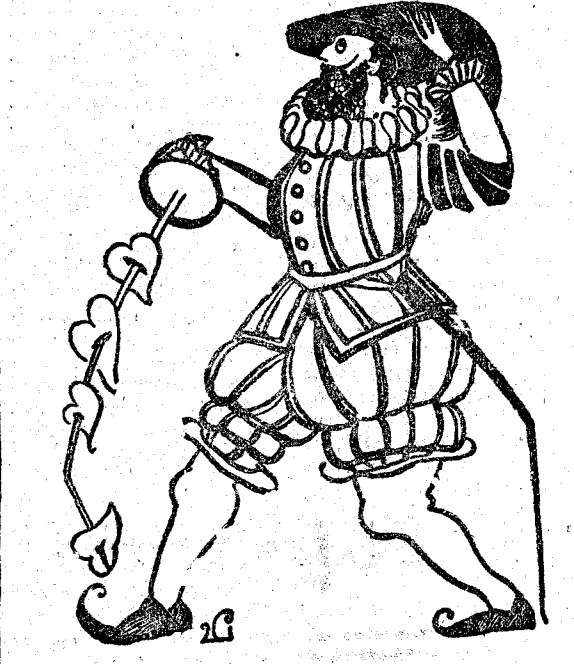
El Dios que hay tras esa altura por donde los astros van sabe bien que amo don Juan por la PECA CURA.

Precios especiales para Bibliotecas. Especialidad en carpetas rotuladas para proyectos de todas clases. G. KOEHLER.-Esparteros, 1.-Teléfono 1.837.-Madrid.