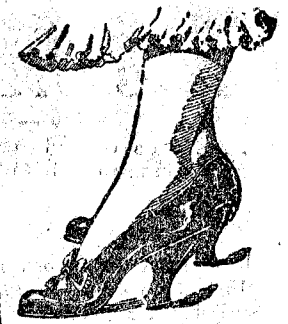
Ahor mismo corte este anuncio. Guardarlo para cuando compra. Fino zapato cosido, 12.50 ptas.