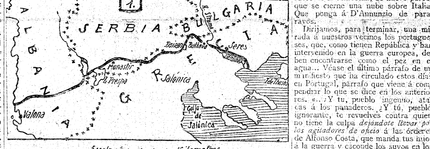
Escala 0. 20. 40. 60 Kilometros