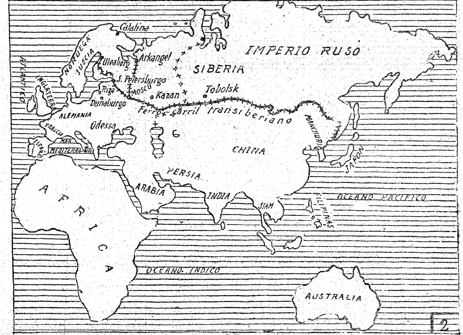
Tobolsk, residencia actual del Zar.

dificil á cañonazos obviar este inconveniente, queda sólo por cerrar (dada la tendencia á los frentes continuos) el callejón comprendido entre la parte septentrional del lago y las orillas del