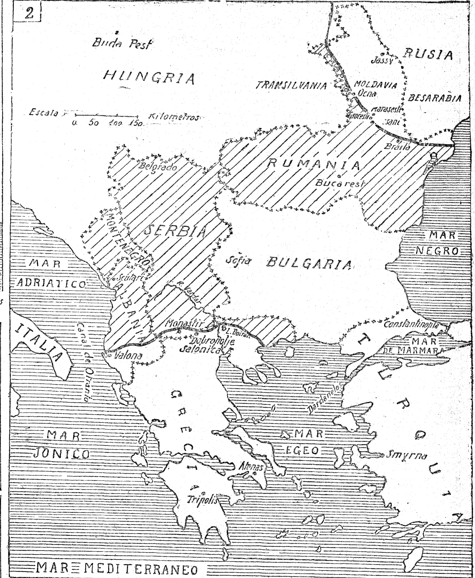
FRENTE RUMANO MACEDONICO Territorios conquistados por los austro-alemanes. Posicion actual de los beligerantes

SERVICIO RADIOTELEGRÁFICO WASHINGTON 4.—En su Mensaje a los nuevos soldados preparados para combatir en Francia, las dice Wilson: «Los ojos del universo entero están fijos en vosotros, seis los soldados de la libertad, que vais a añadir nuevos laureles a la Corona americana.»