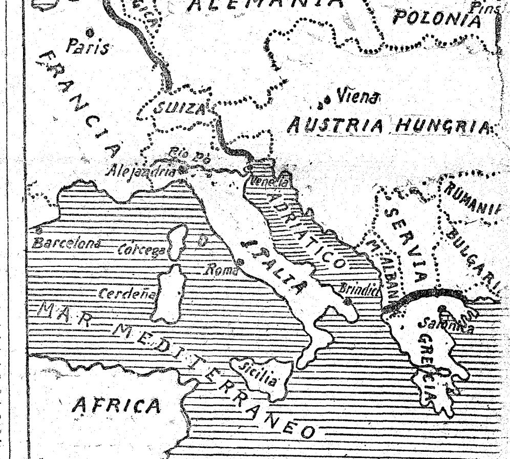
Posicion de la linea de batalla en los diversos frentes europeos

Y por fin, en un radiograma Nauen negando que Ludendorff, jefe de Estado Mayor de Hindenburg, hubiera ido á Rusia para tratar de paz, terminaba por afirmar que aquésta está en el frente occidental. «Ludendorff ahora en Occidente?... Pues ver y con esas... Ya sé que si sólo hubiese este último dato él sería acaso indudable que Ludendorff estaba en Siria ó Mesopotamia; pero únase con los citados anteriormente, de diversa fecha y procedencia, y no se olvide lo que en los diversos frentes ocurre, y ca-