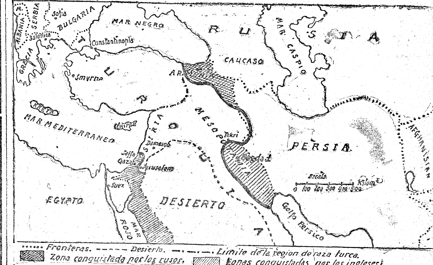
Frateras. Desierto. Limite de la region de raza turca. Zona conquistada por los rusos. Terras conquistadas por los ingleses.

vendrá el lector conmigo en que no tan desatinada la idea de que los austroalemanes, que arrollaron á Italia, después de haber acertado considerablemente el frente y de haber atraído hacia el Veneto á modo de ventosa grandes ejércitos franceses é ingleses, al saber congestionado el frente occidental marchen contra él por el Norte de Siria (Véase el croquis 3.) La escala bien dice que no es grande la distancia que tienen que recorrer los austroalemanes para pasar de Italia á Francia. Hay