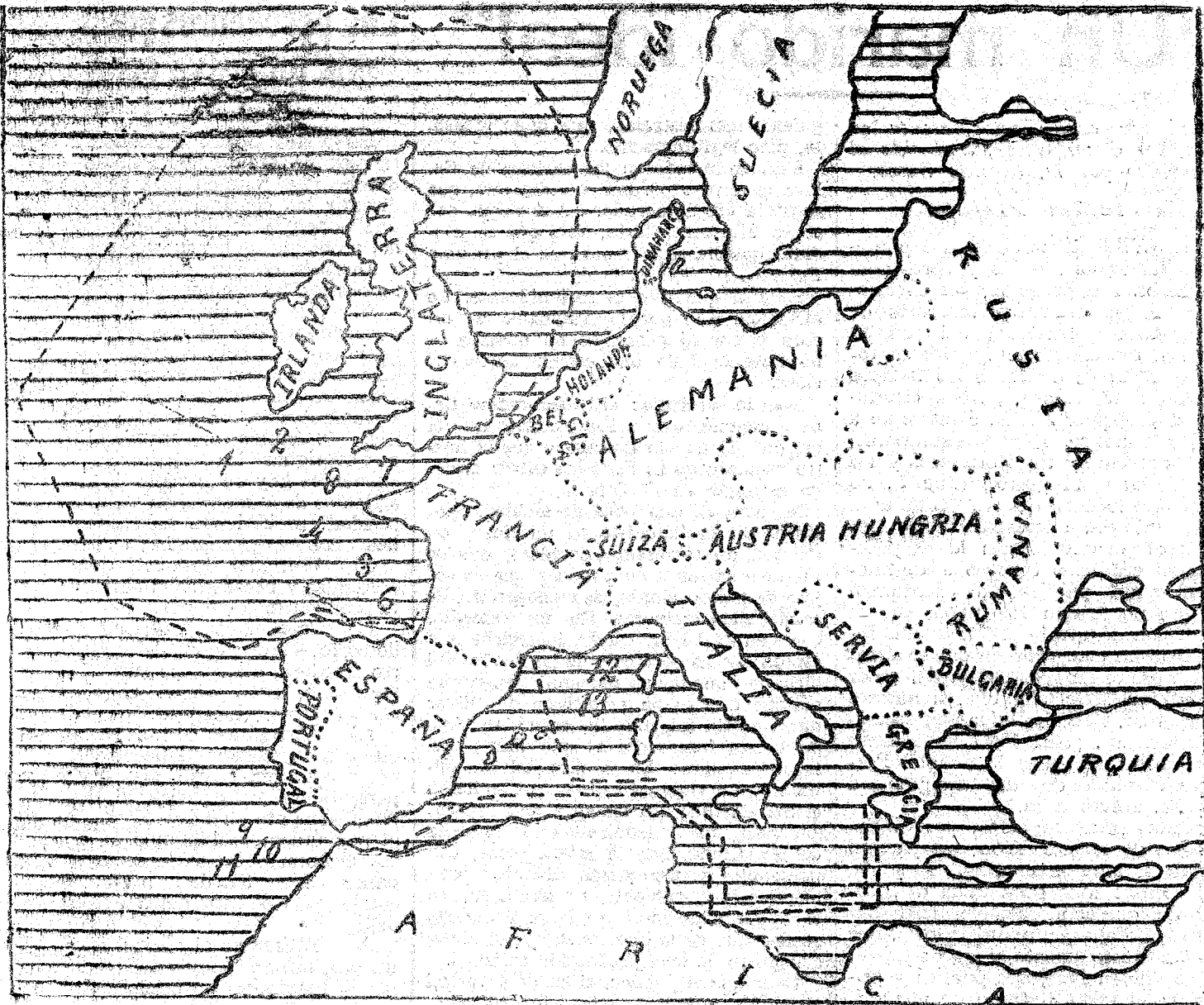
18 barcos hundidos por los submarinos alemanes durante los días 21 al 25 de Septiembre