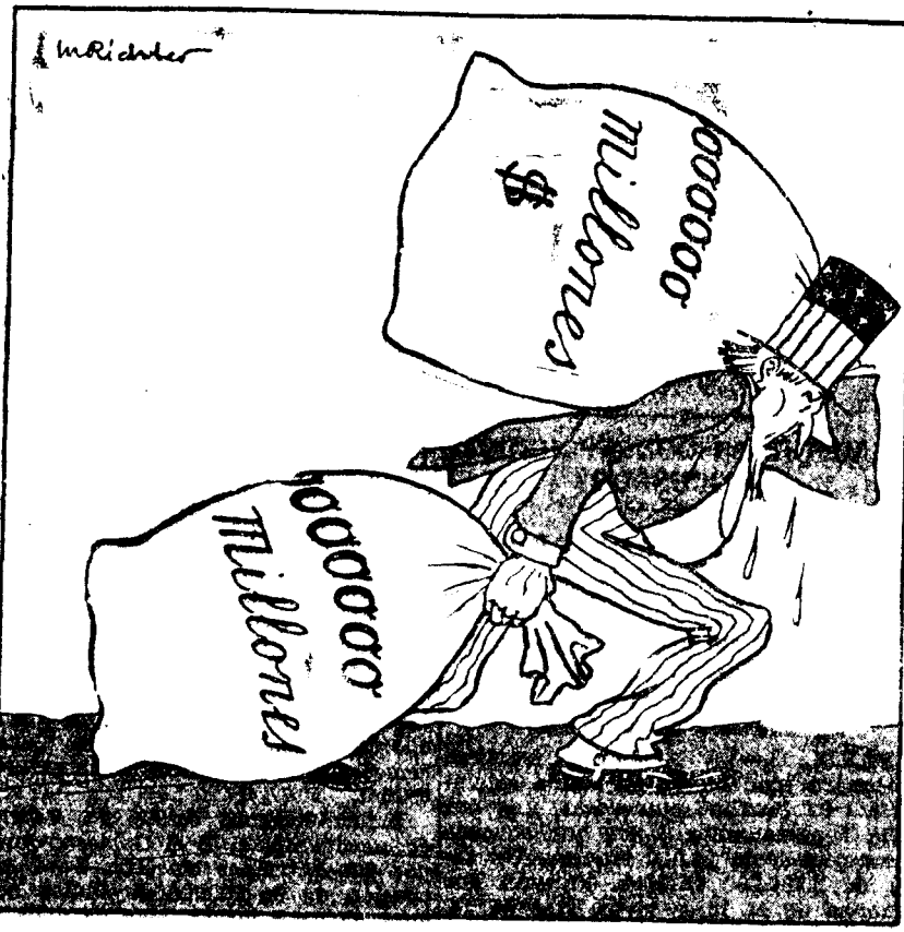
El ex presidente Coolidge dice que Norteamérica no debe soportar los gastos de la guerra ("Kladderatsch", Berlín.)