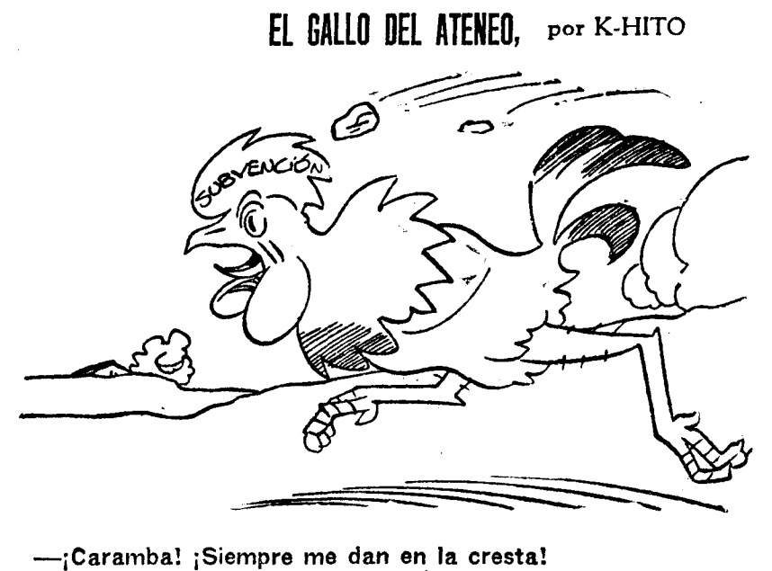
¡Caramba! ¡Siempre me dan en la cresta!

N. de la P. (Madrid).—Respuestas: Primera. Primero se sirve a la señora. Segunda. En la intimidad más absoluta, dado lo rufoso del tío. M. L. (Valladolid).—Tan atento como simpático, y si de nosotros dependiera complacerle, "eso" estaba hecho. Una orientación: ¿Por qué no se