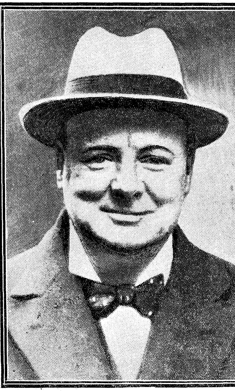
Churchill, ex ministro de Hacienda, que se separa del partido conservador inglés

Se explica que el "teniente Churchill", ex combatiente de la guerra angloboer y "francotirador" por temperamento, se separe de sus correligionarios a causa de las contemporalizaciones, debates y tolerancias que presiden la política británica en la India. Quizás hemos empleado mal la palabra correligionarios: Churchill no los ha tenido nunca. Ha sido liberal, coalicionista, constitucionalista, conservador. Sus grandes dotes intelectuales le hacían olvidar la versatilidad de sus convicciones. Pero no está llama. do a ser presidente del Consejo. En Ingaterra, difícilmente alcanza este cargo un hombre que, según Asquith, carece del sentido de la proporción. Cierto que llegó a tal Lloyd George, no mucho mejor dotado que Churchill en este aspecto. Pero fué en una época desproporcionada, durante la guerra. Este carácter hace que Churchill enjuicie con dureza la política de su patria en la India, sin darse cuenta de que hay momentos en que hasta el león británico ha de resignarse a no hacer más que lo que le permitan los demás pueblos.