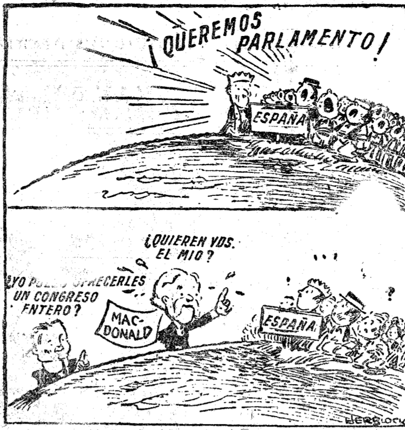
VOCES DE OTROS PAISES ("Nueva York Mirror")

tar que las contestaciones a dicho cuestionario deben ser sólo redactadas por los centros y no individualmente. Añadió el señor Gascón que visitó el Museo que donó Sorolla al Estado y que constituye una valiosa joya de arte. Dijo el ministro que en breve se organizará un patronato para administrarlo. Por último manifestó que había concurrido ayer a la inauguración de una cantina que lleva el nombre Jaime Vera.