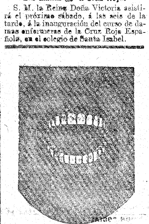
La boca se debe abrir solamente en tres casos:

S. M. la Reina Doña Victoria asistirá el próximo sábado, a las seis de la tarde, a la inauguración del curso de damas enfermeras de la Cruz Roja Española, en el colegio de Santa Isabel.