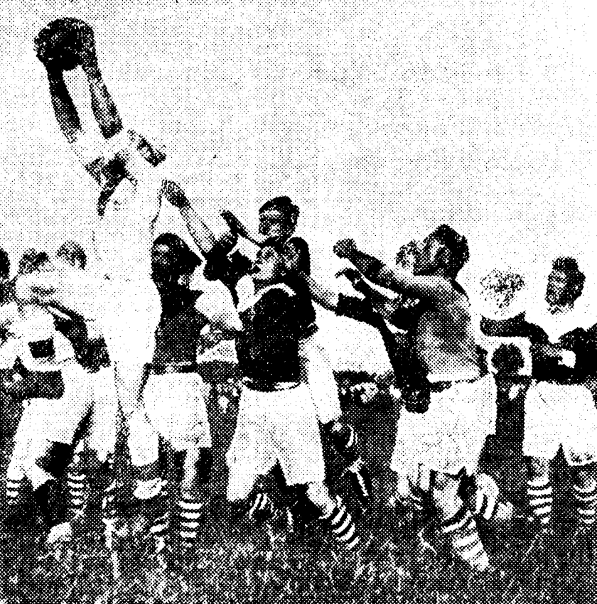
Una fase muy interesante del partido jugado entre barceloneses y franceses, ganado por los campeones de España