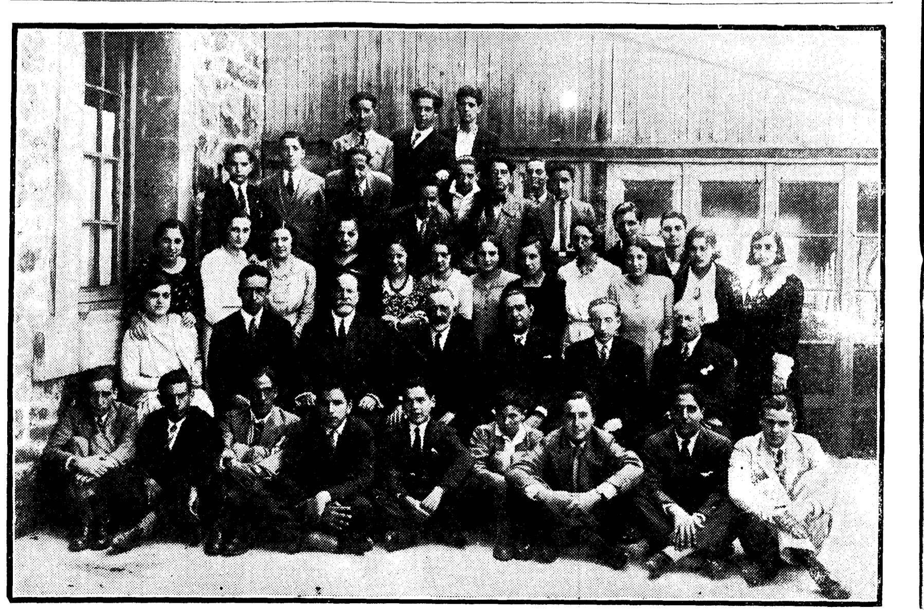
Alumnas y alumnos de bachillerato que celebraron el domingo en Bilbao la terminación del grado con sus profesores. La fotografía los representa después de un banquete en Archanda

NUEVA YORK, 25.—Un despacho de Tegucigalpa dice que las fuerzas gubernamentales hondureñas han causado una gran derrota a las fuerzas rebeldes al mando del general Ferrera. El encuentro ocurrió cerca de Toa, y, según noticias de carácter gubernamental, el campo de batalla quedó cubierto de cadáveres de insurrectos. Con la derrota de Toa se considera casi terminado el levantamiento sedicioso.—Associated Press.