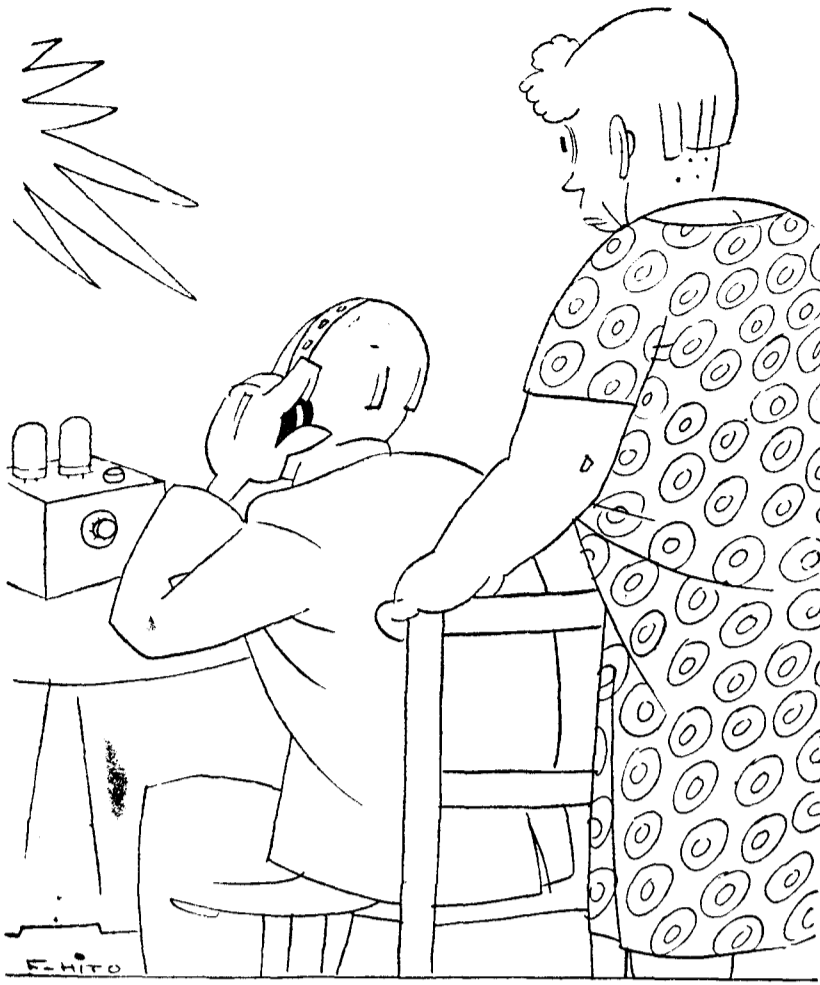
—Espera un poco, Milagritos. Aún no sé si es la voz de Saborit o es música de baile.