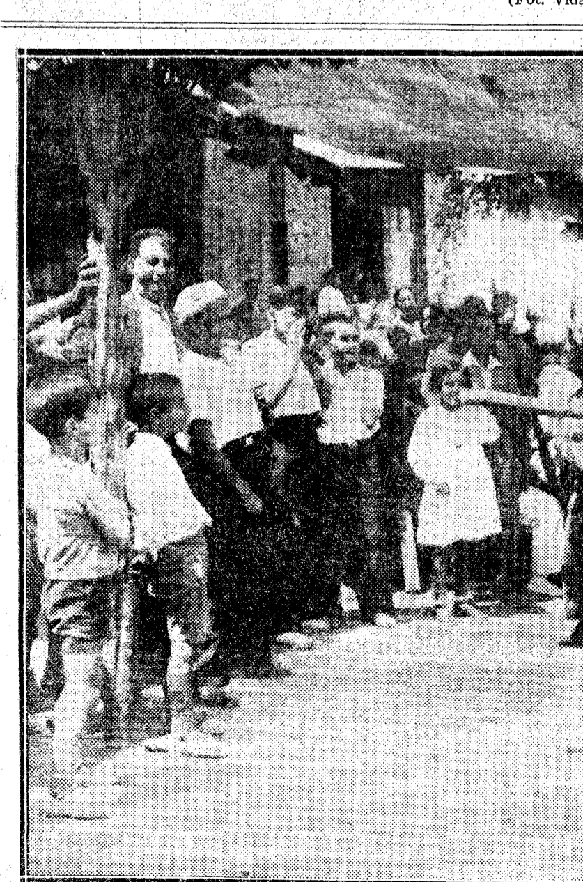
BARCELONA. En la ermita del Carmelo el Centro Cultural de las Puellas ha celebrado una fiesta infantil. Uno de los juegos consistía en romper "a estacazos" una olla colgada