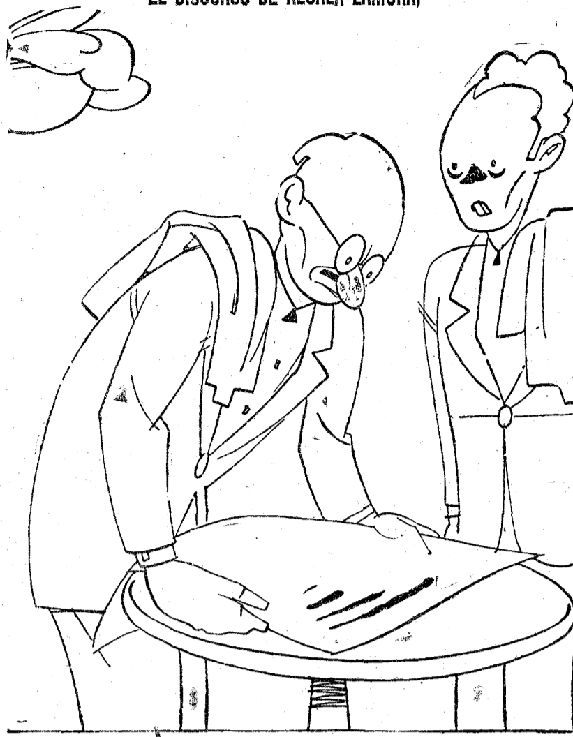
—No viene íntegro, pero dice que continuará.