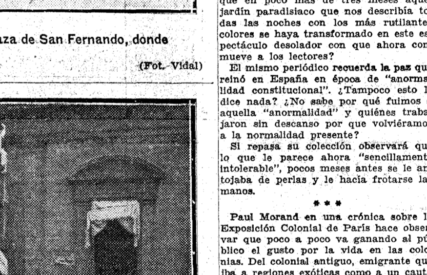
Uno de los innumerables cacheos

Los militares custodiando la Sucursal del Banco de Bilbao