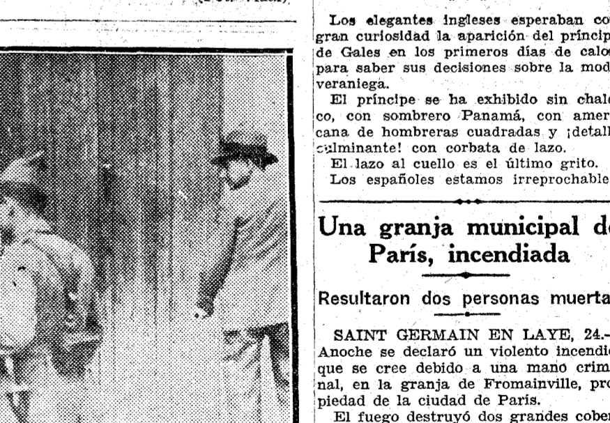
Los militares custodiando la Sucursal del Banco de Bilbao