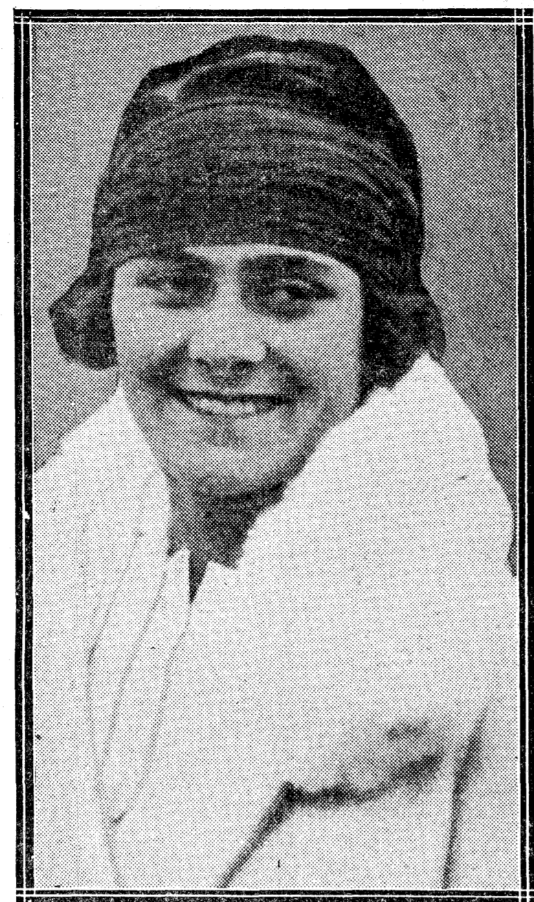
La señorita Lili Alvarez, la famosa jugadora de tenis, que ha llegado a Madrid en calidad de periodista para hacer información de las Constituyentes

Esta nueva actividad de Lili Alvarez acaso no aparte a la eximia jugadora de su terreno al extremo que podría pensarse. Le ocurrirá más de una vez observar cómo los diputados se echan unos a otros la pelota y cómo alguno la devuelve con sorprendente prontitud y agilidad y otro no puede más que bracear en el vacío. Echará tal vez de menos, en alguna ocasión, las normas correctas de un deporte elegante; pero tampoco la diferencia será mucha, porque los hombres juegan al tenis en mangas de camisa. Desearamos a la nueva compañera en la Prensa muchos éxitos en su actuación.