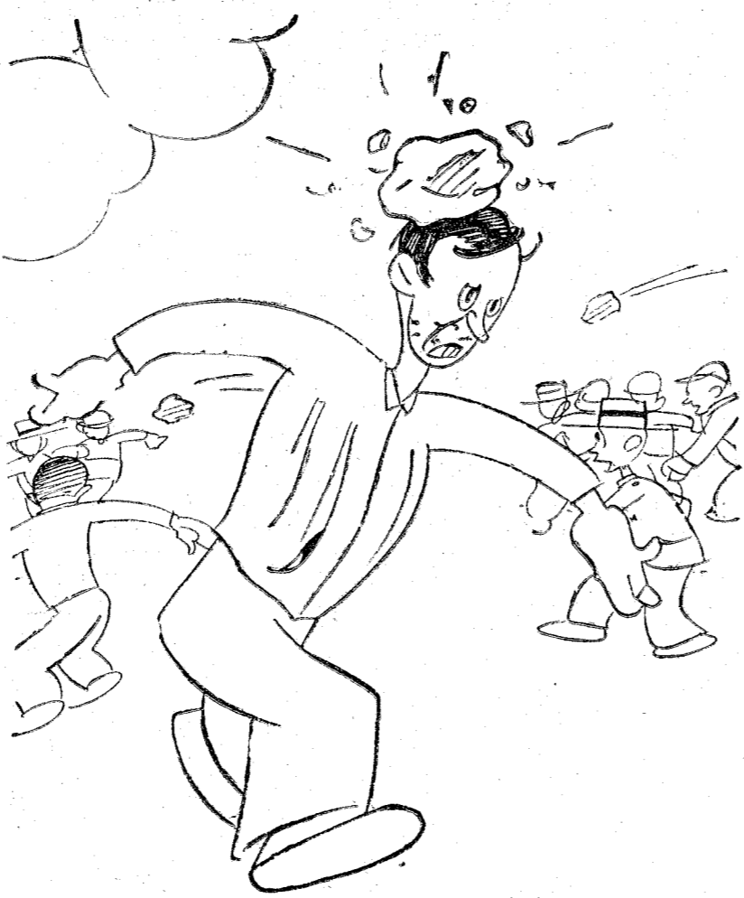
—¡Comparito e mi arma! ¡Que yo con mucho menos tenía bastante!