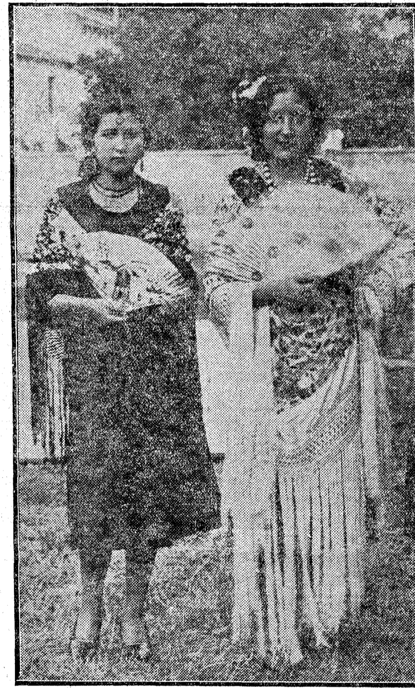
ZARAGOZA. Dos bellas muchachas que asistieron a la verbena organizada por la Asociación de la Prensa