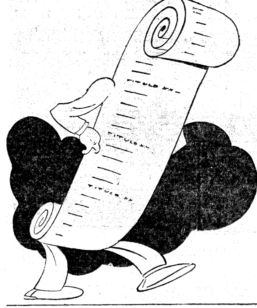
"Largo, largo, y maldito lo que valgo".