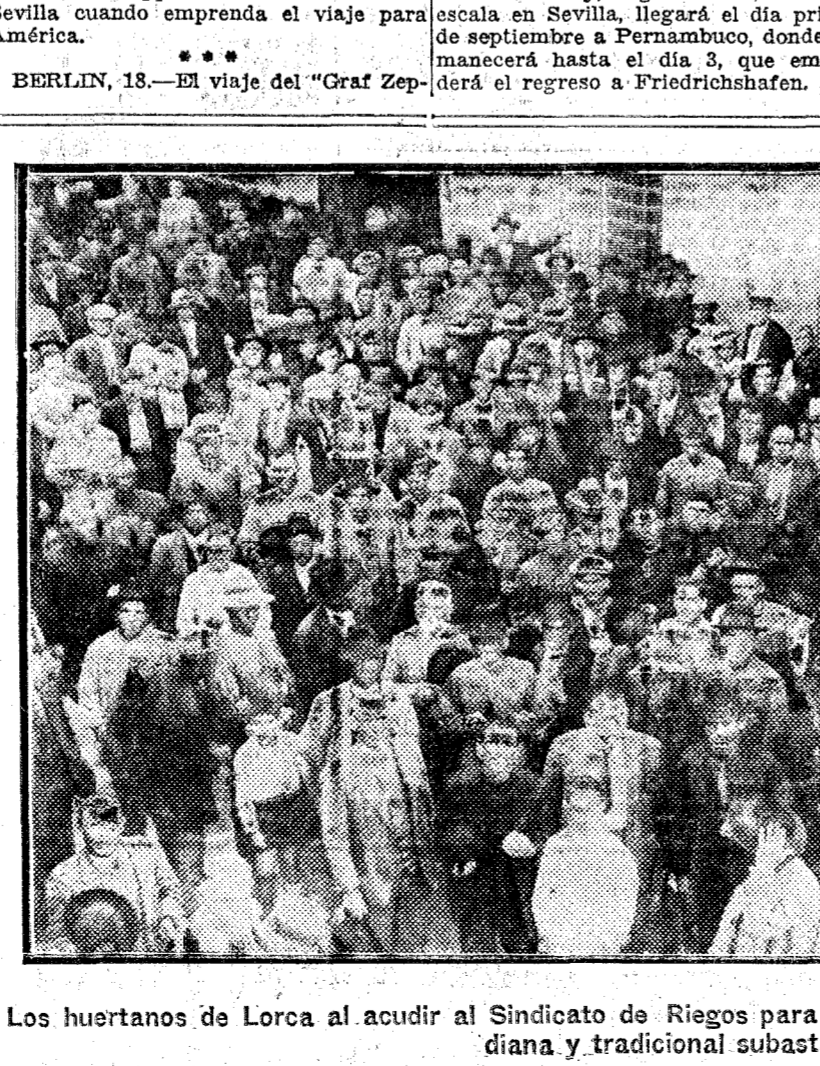
Los huertanos de Lorca al acudir al Sindicato de Riegos para pagar las aguas adquiridas en la cotidiana y tradicional subasta.

NAUEN, 18 (38.2).—Dicen de Spitzberg que el submarino "Nautilus", de Wilkins, ha salido hoy para realizar el primer intento de navegar por debajo del hielo en las zonas polares. Se cree que hará solamente un primer viaje de reconocimiento y que volverá dentro de pocos días, antes de lanzarse a la expedición decisiva.