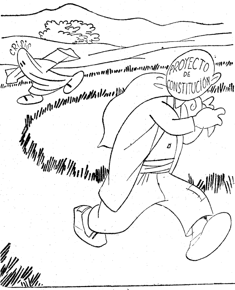
No tengo otro remedio que aligerar, porque me vienen pisando los talones.