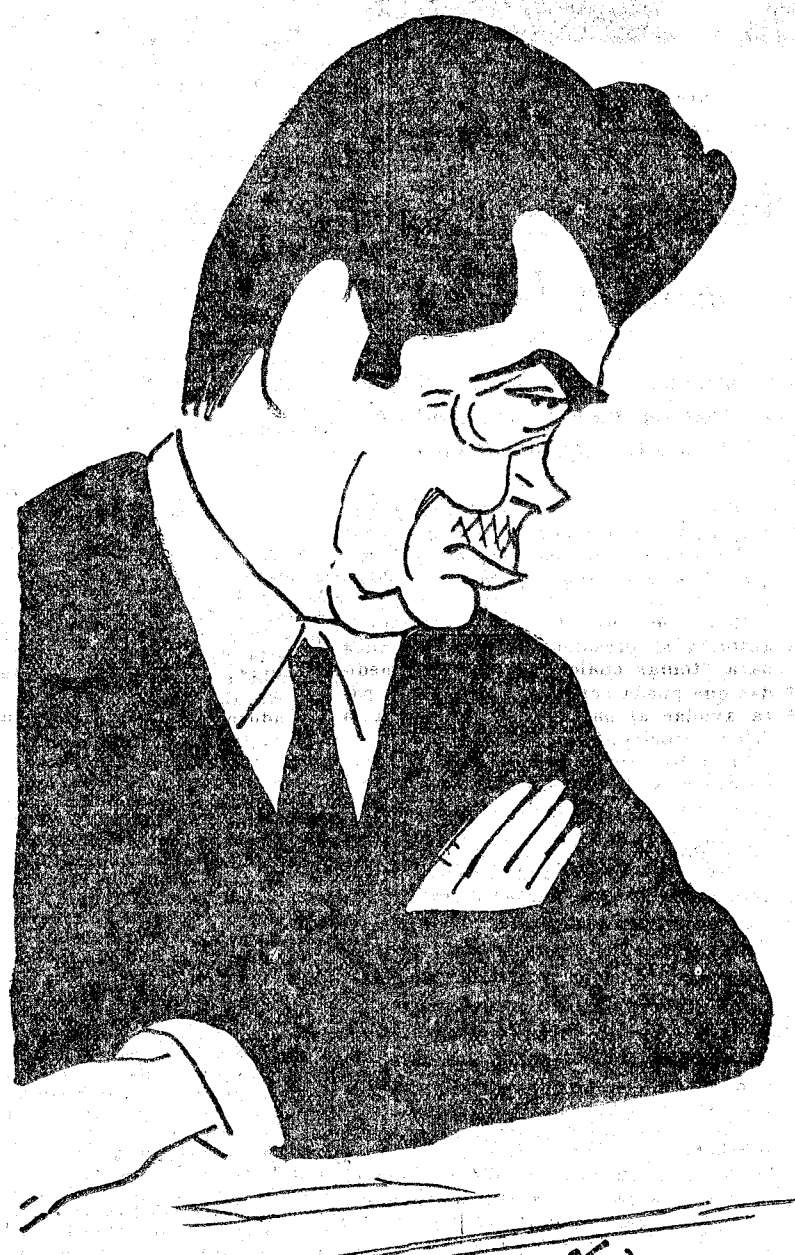
GUERRA DEL RIO