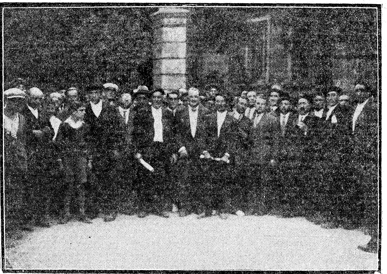
Los alcaldes vascos al salir de la Presidencia, después de la entrega al jefe del Gobierno del Estatuto de Estella.