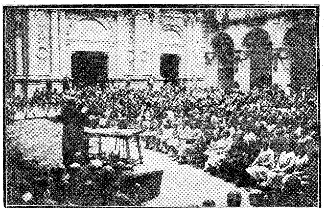
Apertura en el Monasterio de Montserrat de la Exposición del Libro montserratino, con motivo de las fiestas del año jubilar.

El vencido recibió varios cabezazos, aunque su preparación no era muy cuidada