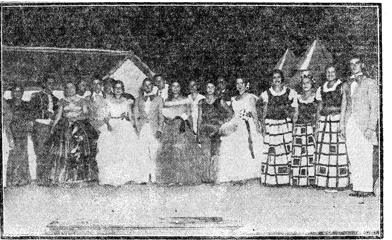
Jóvenes de la colonia veraniega de Vilasar de Mar, que tomaron parte en la revista "Vilasar Revue 1931"

BUDAPEST, 22.—La Agencia Telegráfica Húngara desmiente las noticias reproducidas por determinados periódicos extranjeros, según los cuales estaba a punto de producirse en Hungría una crisis ministerial.