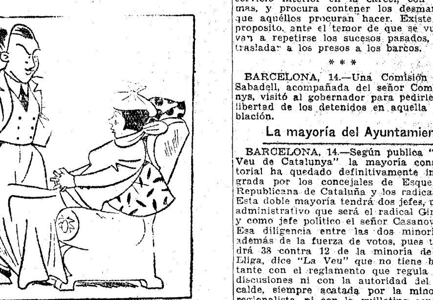
—El médico me ha prohibido cantar. —¿Y yo que no tenía confianza en ese hombre!