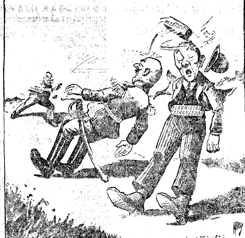
DOS PAJAROS DE TIRO ("New York Times")