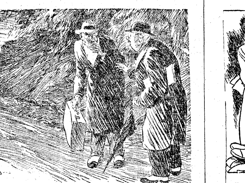
EL CIUDADANO PRECAVIDO (en voz alta, al ver que avanzan tipos sospechosos).—Me he venido sin una perra. ¿Puedes prestarme un real para el tranvia?