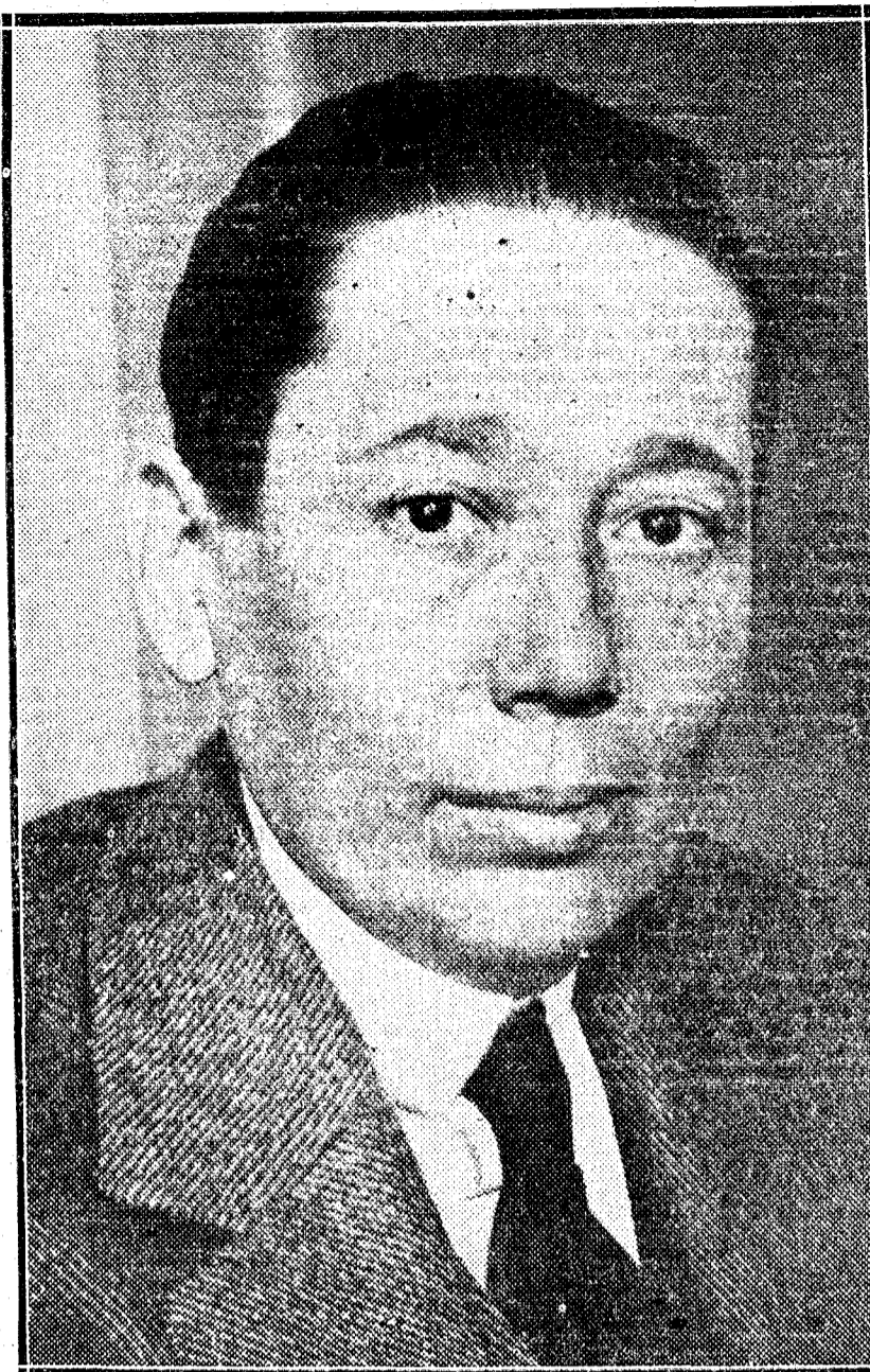
Nicolás Titulesco, representante de Rumania, elegido por segunda vez presidente de la Asamblea de la Sociedad de Naciones