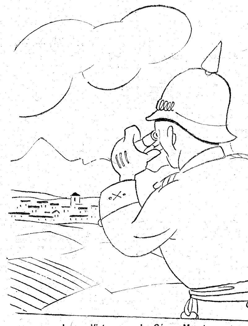
Jaca.-Vista general... Gómez Maroto