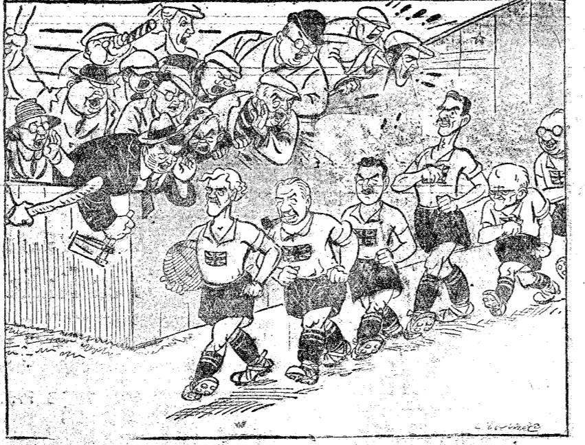
EL GOBIERNO INGLES F. C. SALTA AL CAMPO, EN MEDIO DE GRAN EXPECTACION