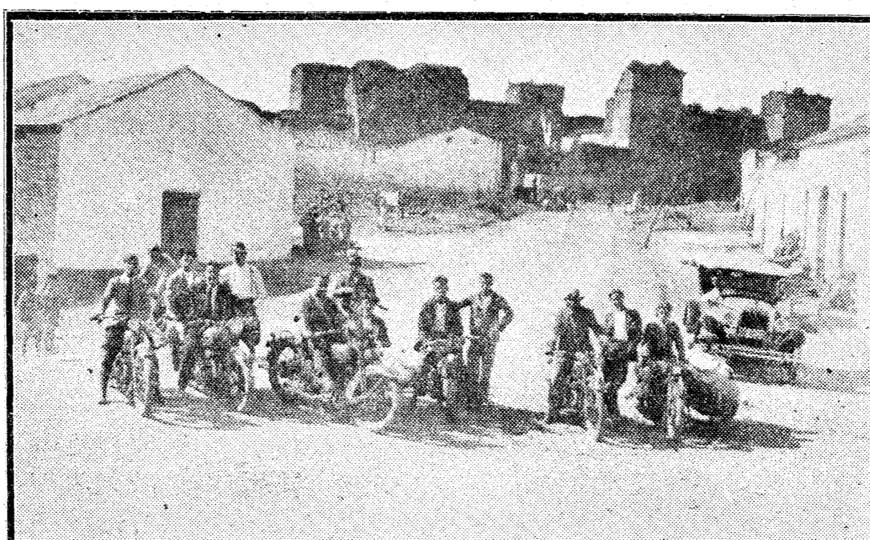
SEVILLA. Los primeros motoristas que llegaron a Niebla. Al fondo se observa el histórico castillo del condado de Niebla.

18 se suspendió la prueba, quedando don José Allende sin cero, el señor Bernabeu con un cero y diez tiradores más con dos. El resto fueron eliminados.