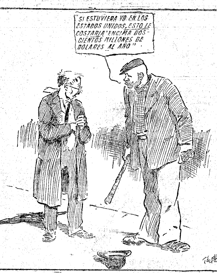
Según la última estadística, la criminalidad le cuesta al contribuyente de los Estados Unidos doscientos millones anuales ("Birmingham Mail".)