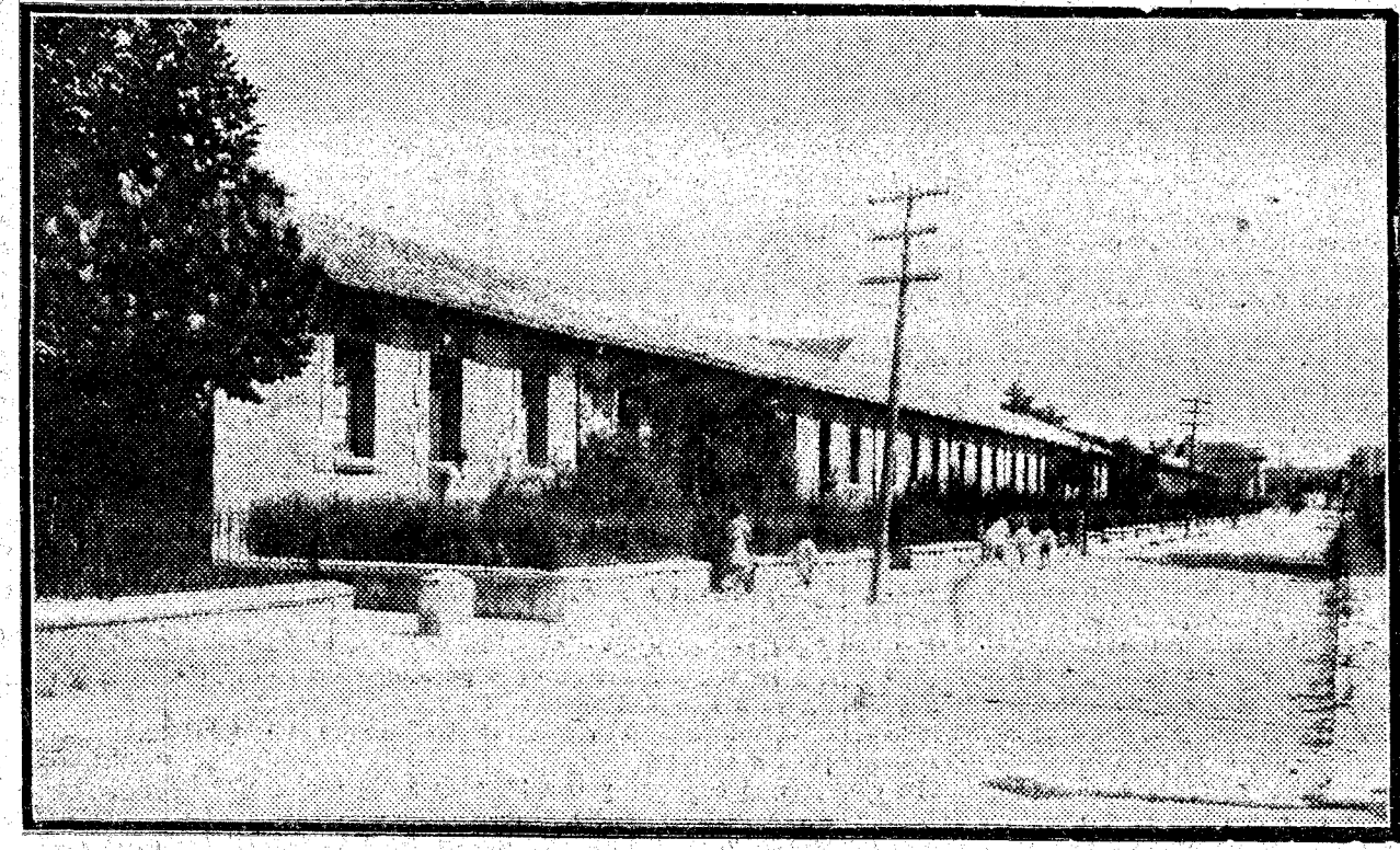
BURGOS. Detalle de la barriada recientemente construída por el Circulo Católico de Obreros.

Las tribunas del Parlamento inglés las va a ocupar virtualmente el mundo entero. No se puede expresar con otra frase más justa la preocupación, la ansiedad generales ante la apertura de la Cámara de los Comunes. Todavía no puede aventurarse sin grave riesgo, provisiones de ninguna especie. Las dificultades no sólo la extrema reserva del Gobierno inglés, sino los síntomas reiterados de la oposición, mientras en su zona central se fortalece, en toda su periferia, en cambio, se debilita visiblemente. La cohesión y el verdadero poder de la oposición laborista contra el Gobierno no podrá graduarse hasta tanto que los debates comiencen y con ellos las revelaciones que pueden ser decisivas. Algún ministro conservador