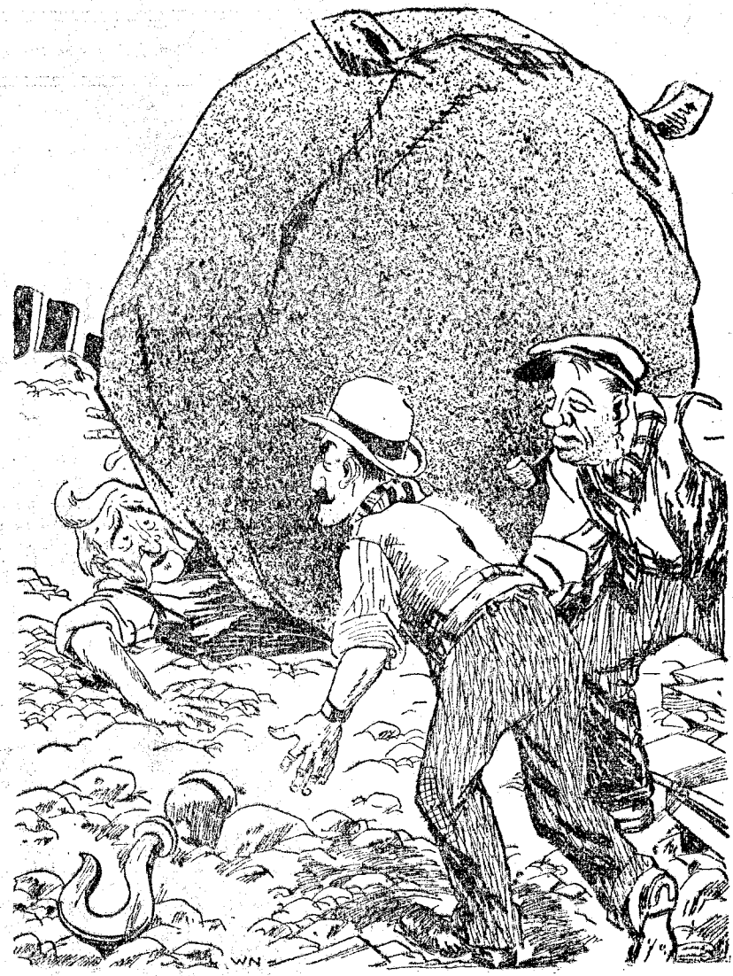
MAGDONALD.—Vamos, amigos; echadme una mano, que no puedo con esta carga. ("Glasgow Bulletin".)