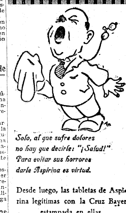
Desde luego, las tabletas de Aspirina legítimas con la Cruz Bayer estampada en ellas.