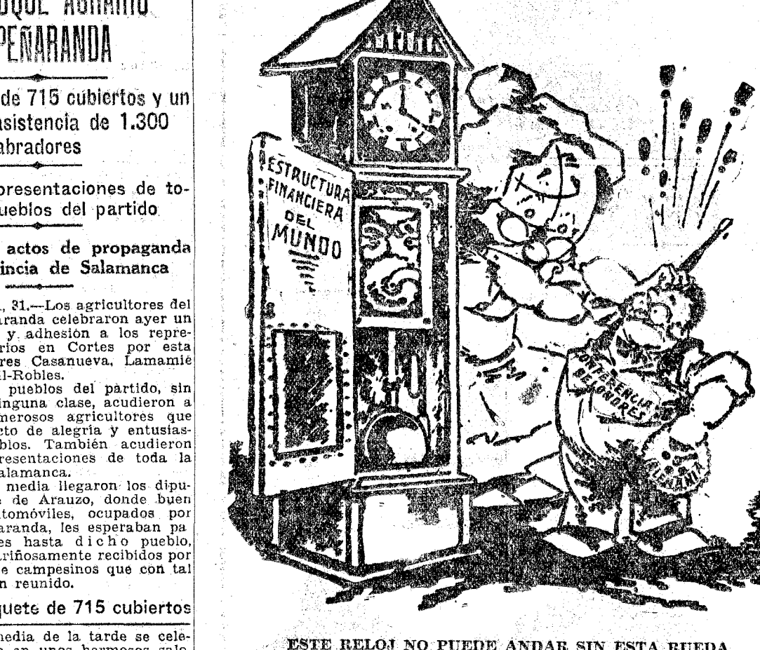
ESTE RELOJ NO PUEDE ANDAR SIN ESTA RUEDA ('Philadelphia Inquirer')