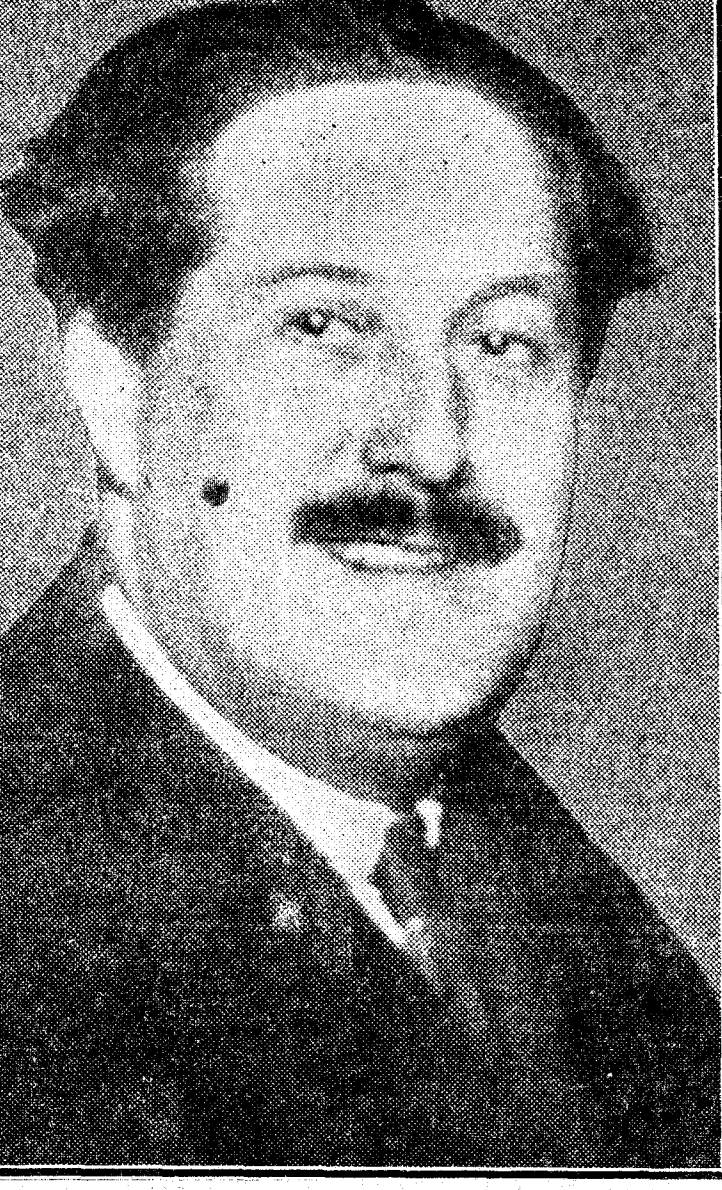
M. Cathala, que ha sido nombrado ministro del Interior del nuevo Gobierno francés