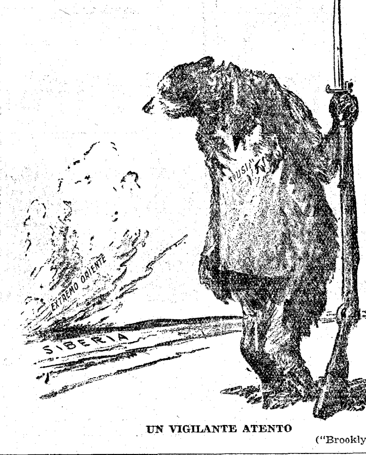
UN VIGILANTE ATENTO

NATEL ES LA SALUD DE LOS NIÑOS. PRODUCE AUMENTO NOTABLE DE PESO