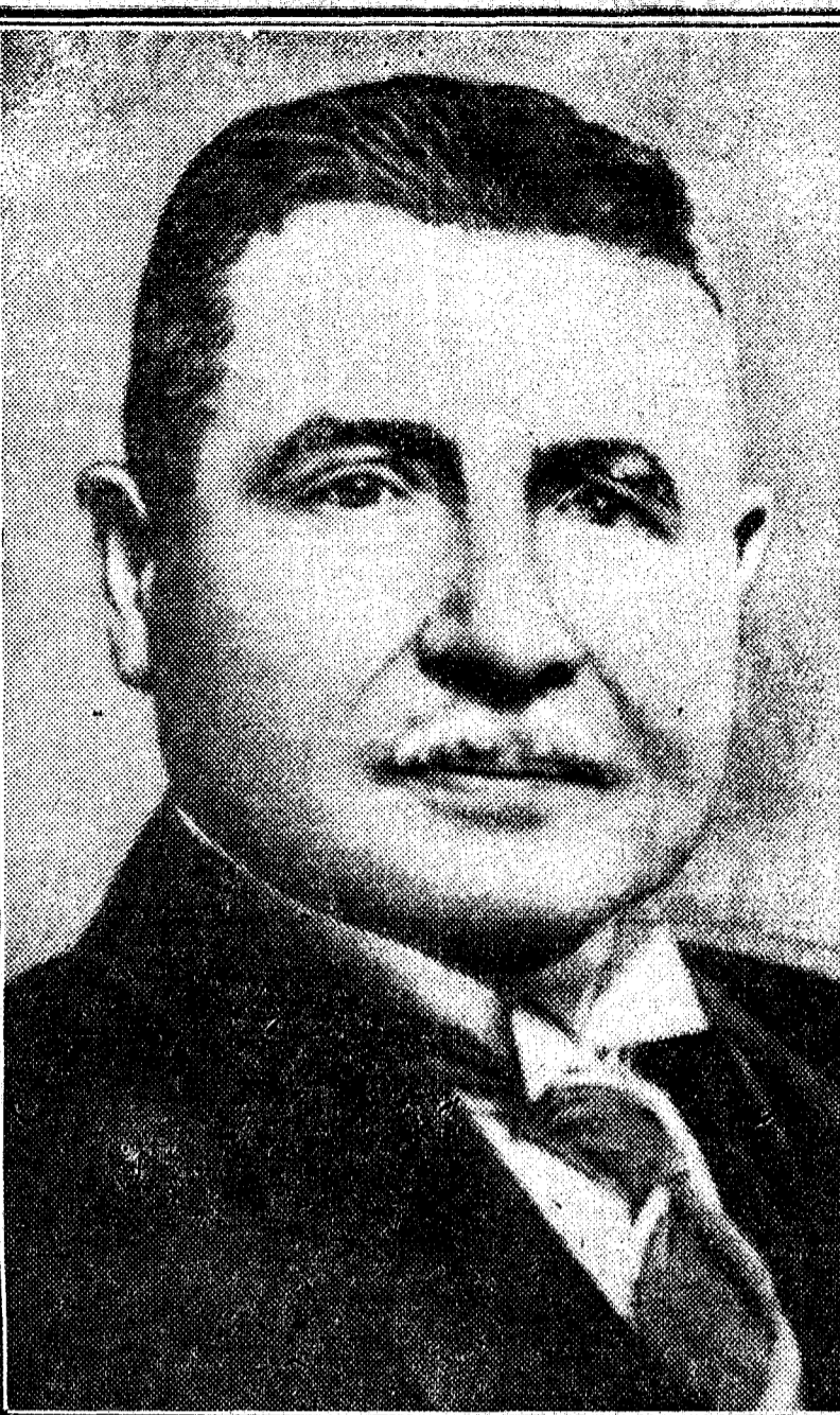
Groener, ministro de la Guerra de Alemania, que ha dimitido

tiar nuestra autonomía espiritual, que en nuestro caso es el aspecto más importante del régimen autonómico.