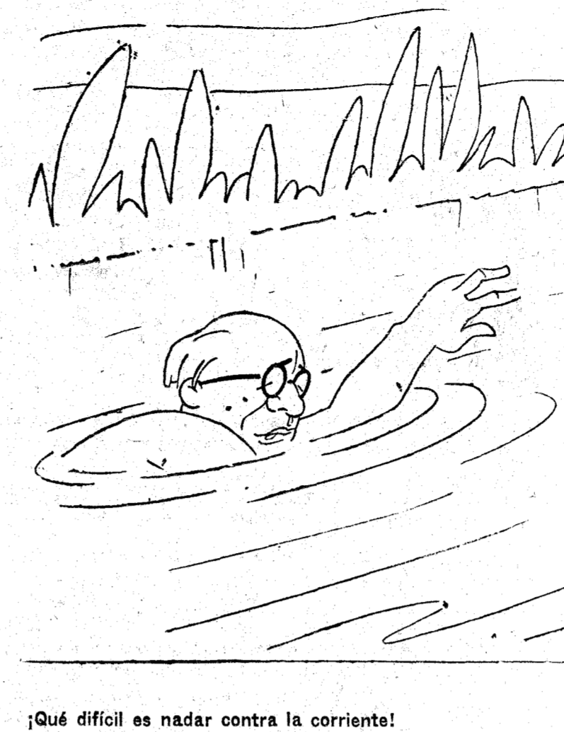
¿Qué difícil es nadar contra la corriente!