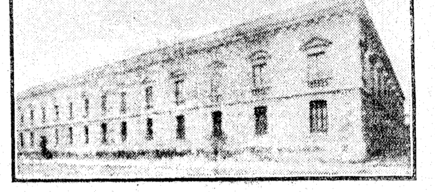
La Universidad de Valencia

La hija del bedel de la biblioteca de Derecho que estaba en una habitación próxima al sitio donde se inició el fuego, oyó que desde los balcones y tejados de las casas de la calle de Salva daban voces de "¡Fuego!"; se levantó inmediatamente de la cama y avisó a sus padres, que aún no se habían acostado. Los padres salieron al patio de la Universidad y avisaron al conserje de la Universidad y demás dependientes del edificio en servicios las bombas, como el jefe de bomberos. Mientras el conserje y demás personal se ocupaban de apagar el fuego, el hijo del conserje avisó al retén de bombe-