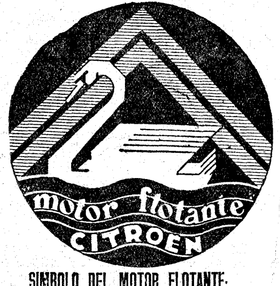
SÍMBOLO DEL MOTOR FLOTANTE. Una marcha suave y silenciosa como la del cisne sobre el agua