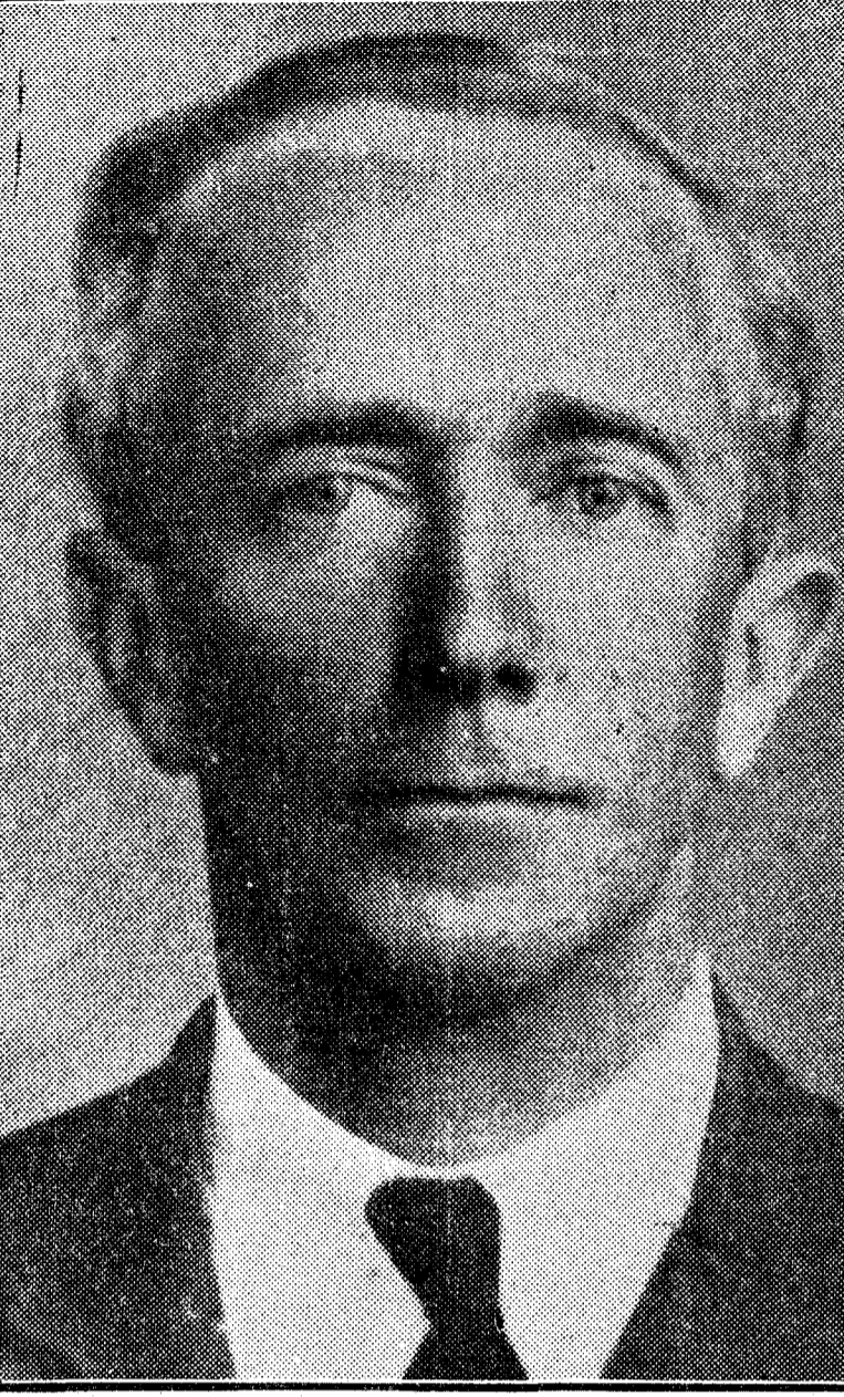
El jefe de la expedición aérea al Everest, comodoro Fellowes

Se ultiman estos días los preparativos de la expedición aérea que manda el comodoro Fellowes. Dos aviones tratarán de remontar el pico más alto del Himalaya, obteniendo películas de los paisajes de mayor altitud de nuestro planeta. En nuestro número de mañana publicaremos una página dedicada a los preparativos del vuelo.