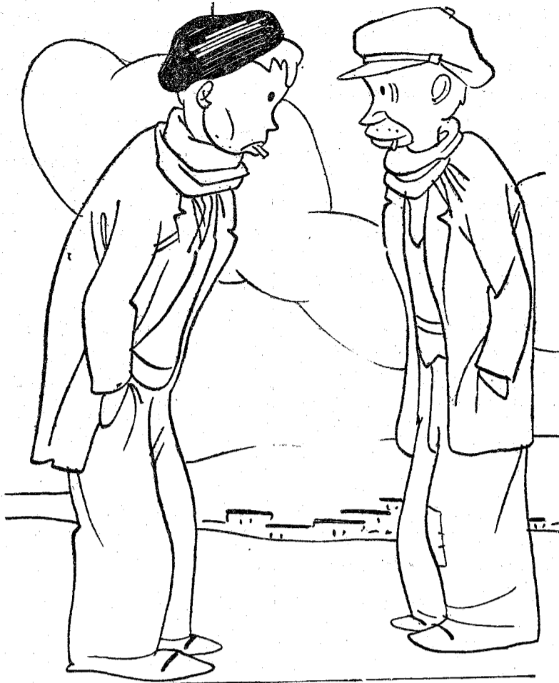
—¿Qué tal va eso? —¡Pchs! Vamos tirando.